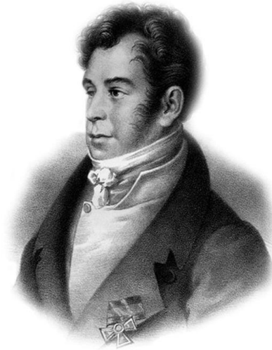
Николай Гнедич (1784-1833) Первый переводчик Гомера в России. В 1829г. издал лучший перевод «Илиады»