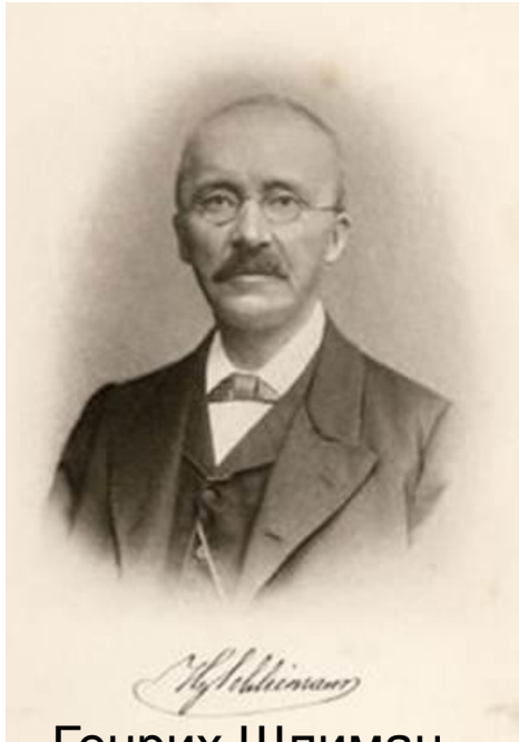
Генрих Шлиман (1822-1890) немецкий археолог. Большую часть жизни посвятил изучению жизни Гомера и раскопкам Трои, Микен, Орхомена, Тирифа