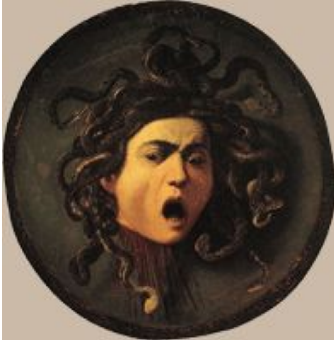
Голова Медузы Караваджо, 1598-99 г. Галерея Уффици, Флоренция.