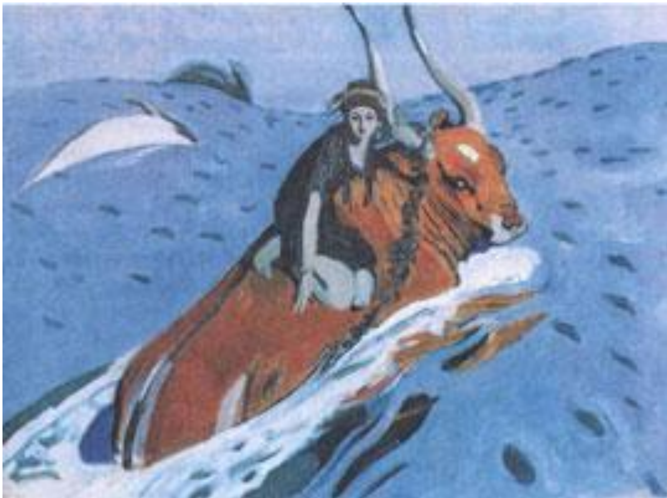
Похищение Европы Валентин Серов, 1910 г. Москва, Третьяковская галерея