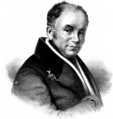
Василий Жуковский (1783-1852) Переводчик Гомера в России В 1842 г издал лучший перевод «Одиссеи»