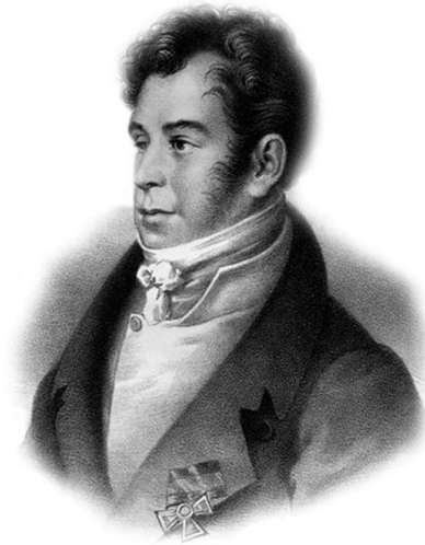
Николай Гнедич (1784-1833) Первый переводчик Гомера в России. В 1829г. издал лучший перевод «Илиады»