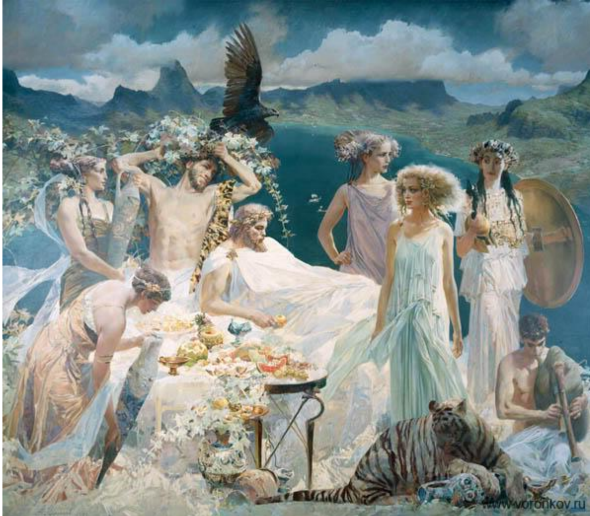
А.Воронков. ЯБЛОКО РАЗДОРА .1999