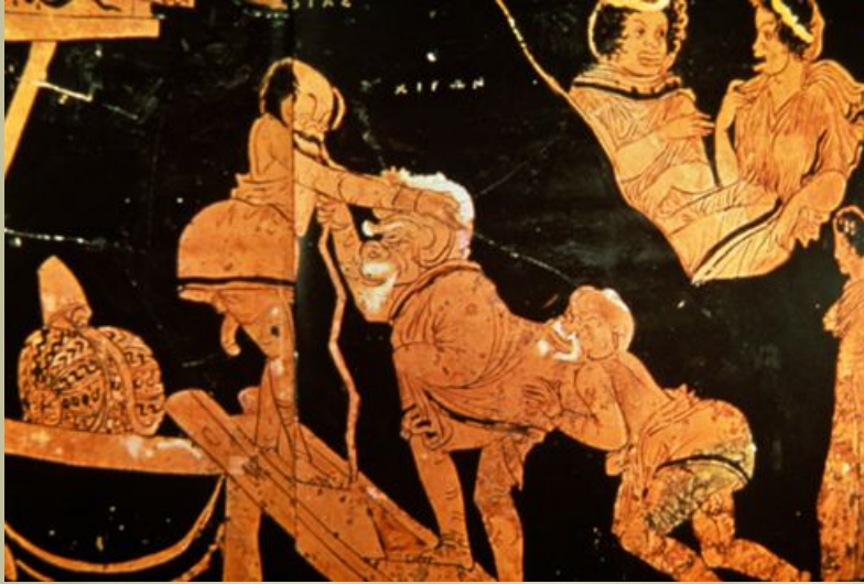
Сцена из древнегреческой комедии. Рисунок на вазе.