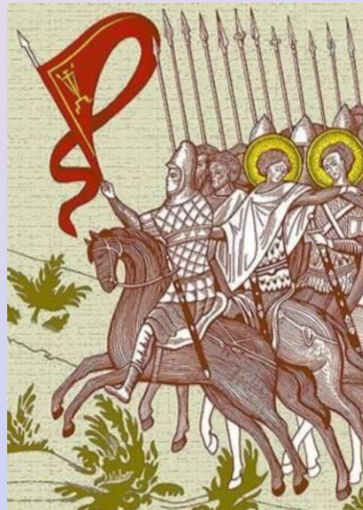
Всадник с полковым знаменем. Прорисовка фрагмента иконы «Церковь воинствующая» Москва, 1550-е годы.

● Древнерусская форма знаменного символа – полотнище одноцветной или узорчатой ткани треугольной или квадратной формы, прикрепленное к древку, имевшему копьевидное или фигурное навершие. Противоположный древку острый угол треугольного стяга мог перерастать в длинную косицу – узкую ленту того же материала.