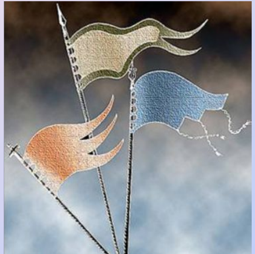
Русские стяги середины X столетия

● Хвосты (языки, яловцы) нередко заменялись скошенным снизу вверх откосом, и подобная конструкция сшивного полотнища удерживалась на Руси вплоть до XVII века. Навершия стягов все чаще становились крестообразными, но прежняя «языческая» их форма еще просматривается на иконах XIV – XV веков.