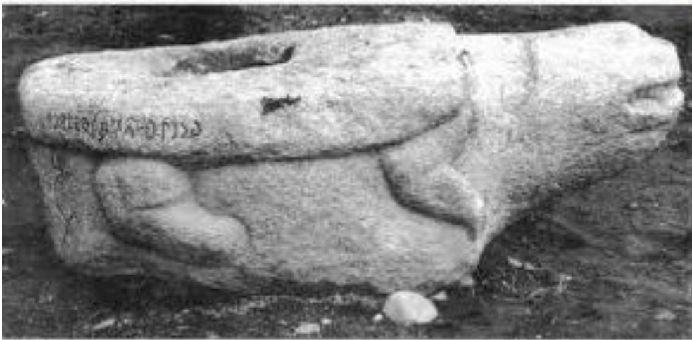
Рис. 26. Каменная черепаха — постамент Терхивской стелы. VIII в. Долина Терхивгола. Монголия.