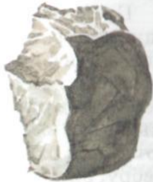
Древнейшее ору- дие труда из камня. Найдено археоло- гами при раскопках.