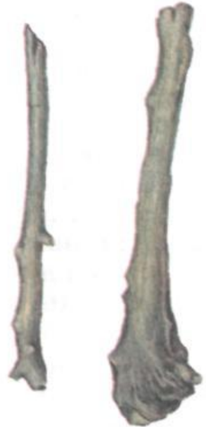
Палка-копалка и дубина. Рисунок нашего времени.