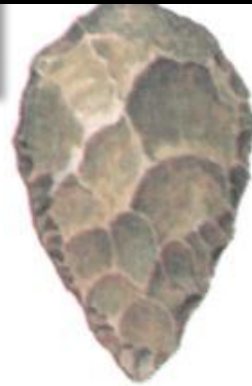
Каменное рубило. Найдено при рас- копках.