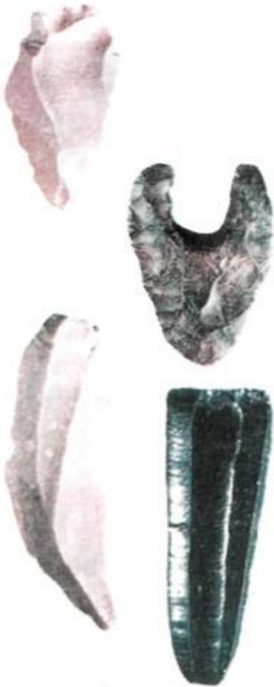
Древнейшие ка- менные орудия