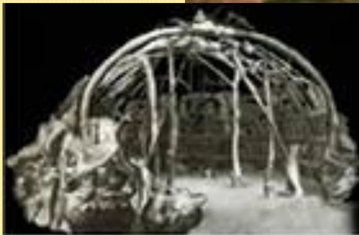
рис. 11. Жилище из костей и шкур мамонтов