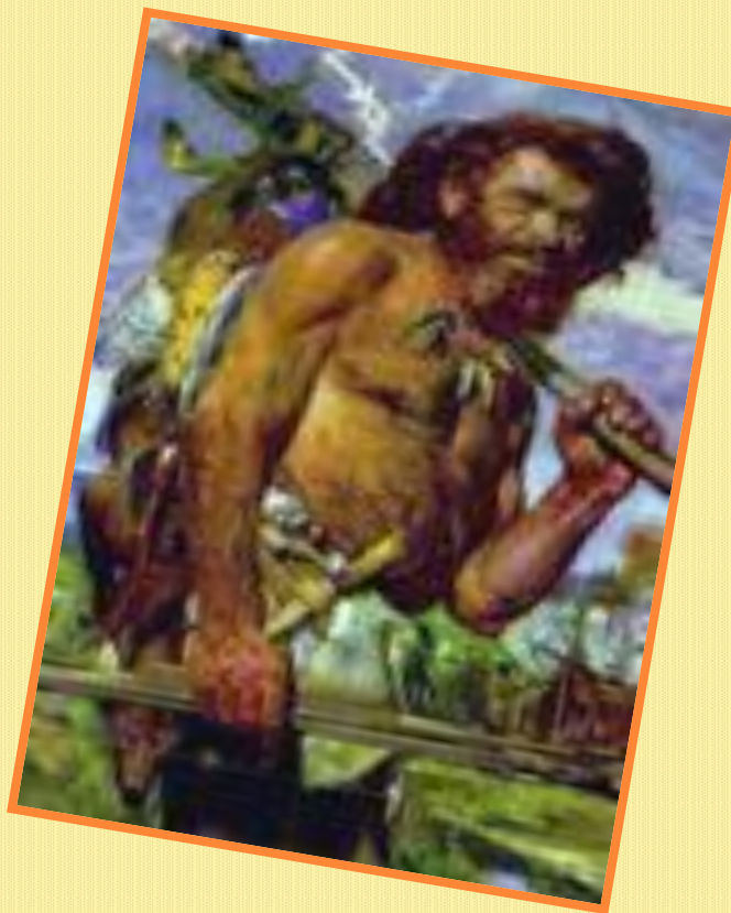
40-35 тысяч лет назад — кроманьонцы