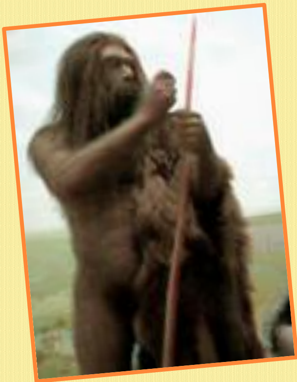
100- 35 тысяч лет назад — неандертальцы