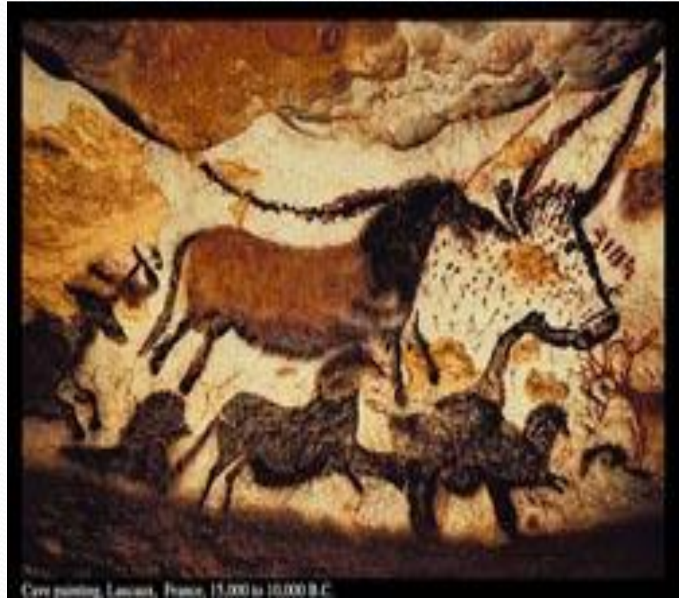
Cave painting, Lascaux, France, 15,000 to 10,000 B.C.