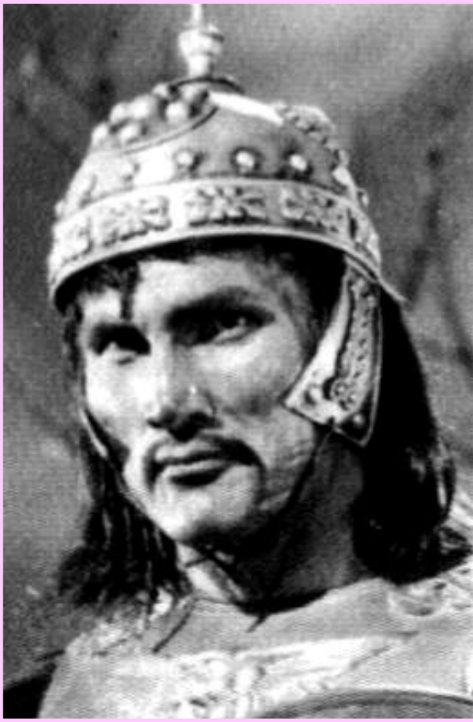
Аттила. Кадр из испанского кинофильма. 1954 г.

? Помните, как назывались кочевники взявшие Рим ?