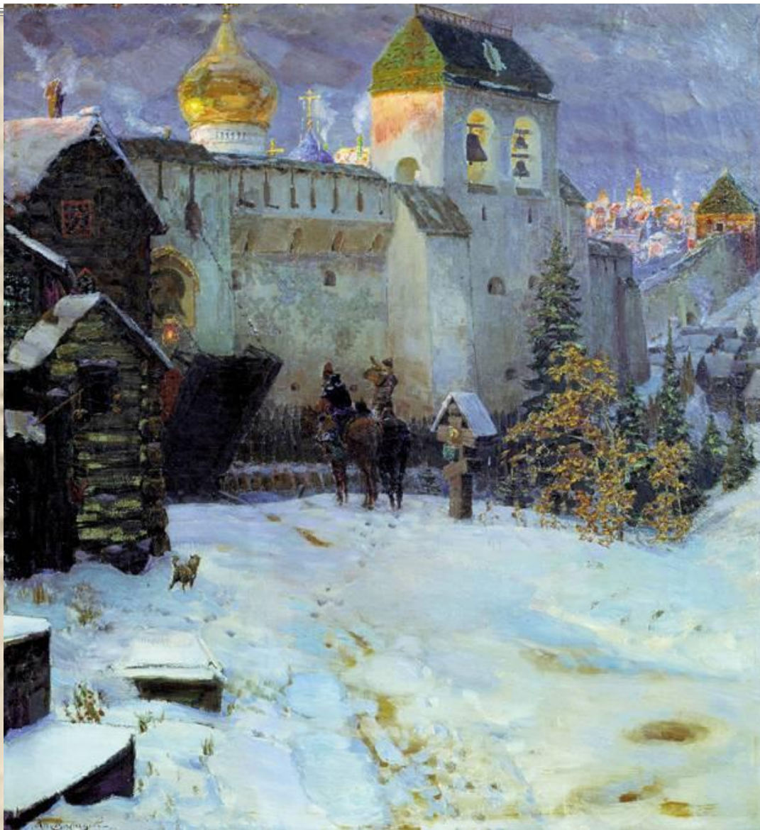
А.М. Васнецов «Древнерус ский город»