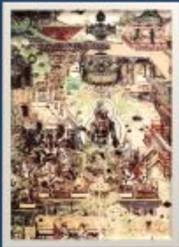
настенная роспись из монастыря Дуньхуан с изображением буддийского рая