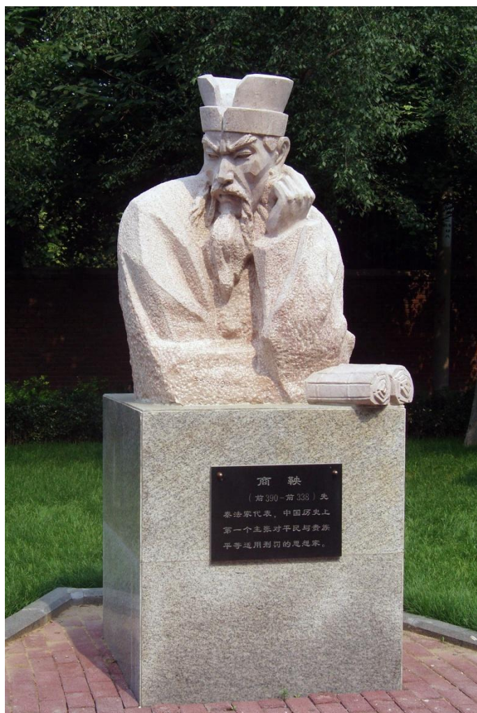
商鞅 (前390—前338) 史 家治家代表，中国历史上 第一个主张对平民与贵族 平等适用刑罚的思想家。