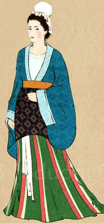
Fig. 2: 220 - 420 AD Wei and Jin dynasties clothing is mainly large and loose