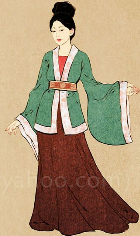
Fig. 3: 420 - 589 AD Northern dynasty