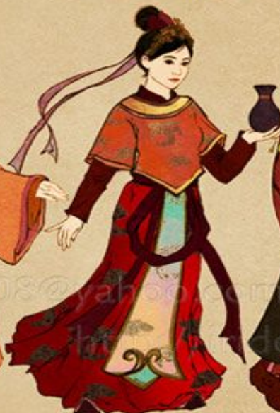
Jade Maiden (Ngọc Nữ)