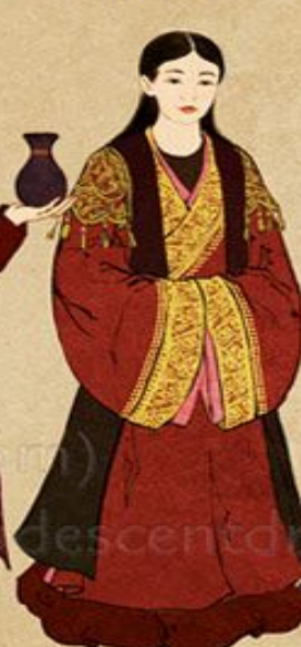
Wife of Official (Phu nhân)