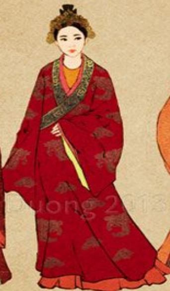
Princess (Công chúa)