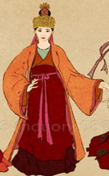
Trinh Lord's daughter (Quận chúa)