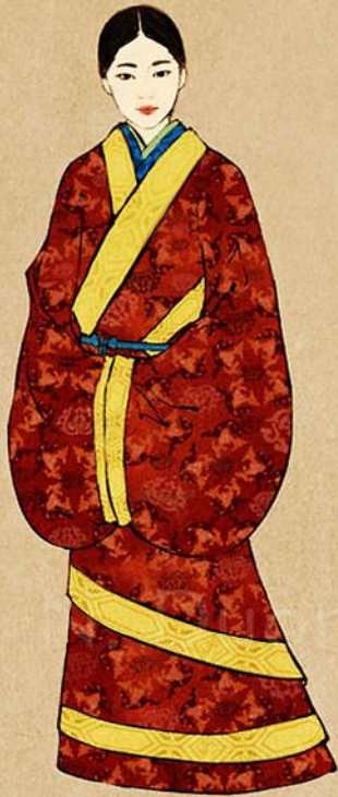
Fig. 1: 221 BCE - 220 AD Qin to Han dynasties 1-piece garment is the de-facto formal wear for women