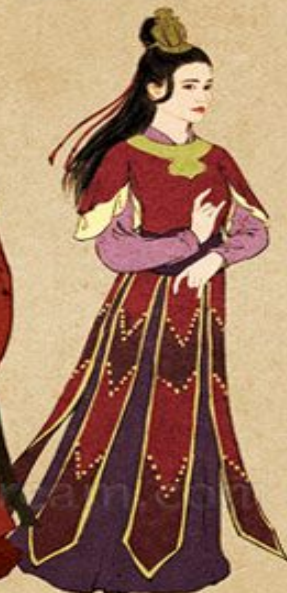
Folk Temple Servant (Thị nữ chùa miếu)