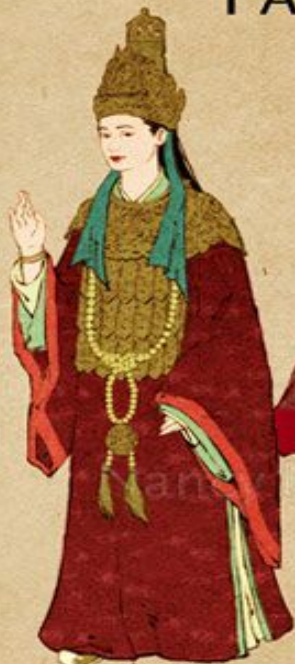
Empress (Hoàng hậu)

Ancient Vietnam from 16th to 18th Centuries