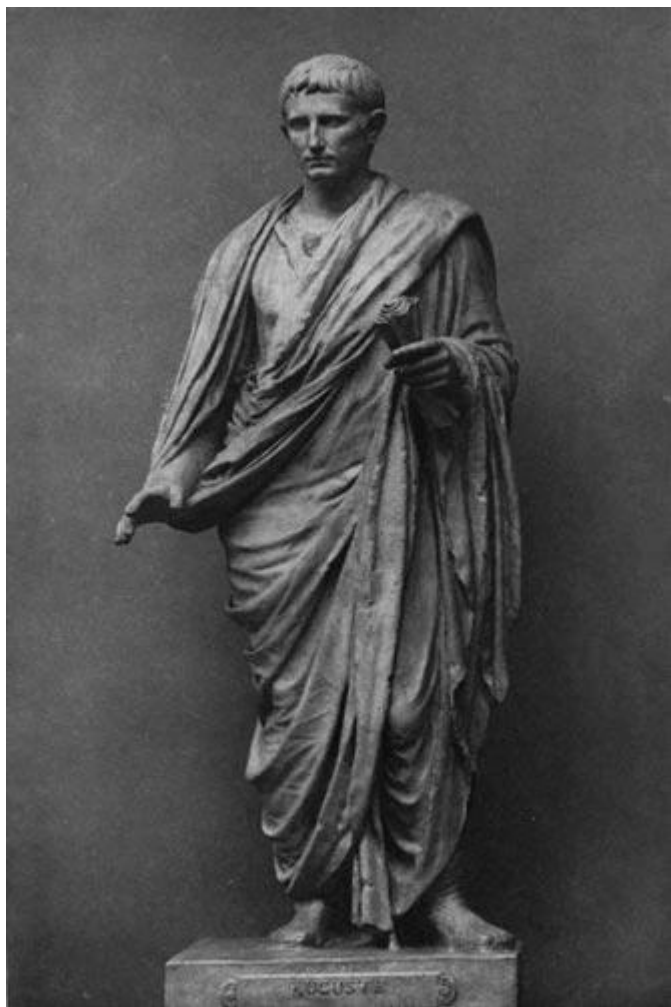
Статуя Августа в тоге