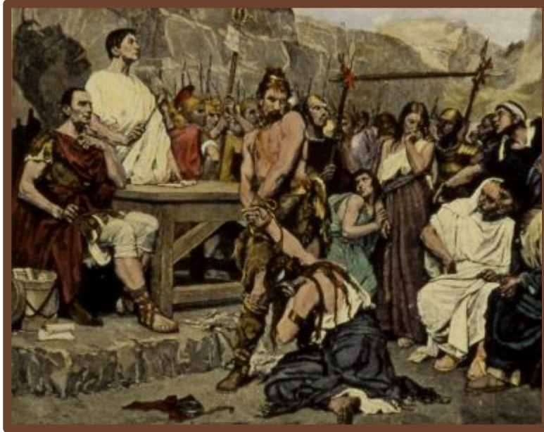
Продажа в рабство за долги