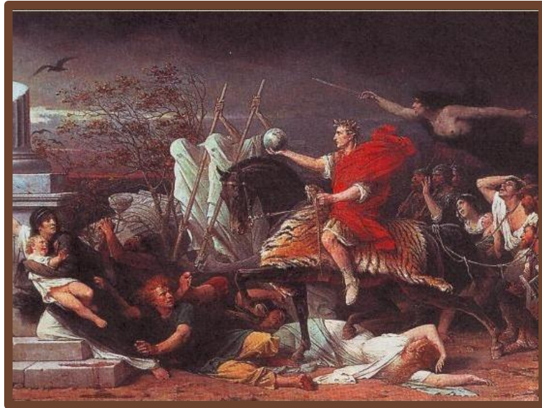
Ж. Л. Давид Триумф Цезаря

60-е гг. до н. э. – триумвират – Гай Юлий Цезарь, Гней Помпей, Марк Лициний Красс. Но: борьба за власть.