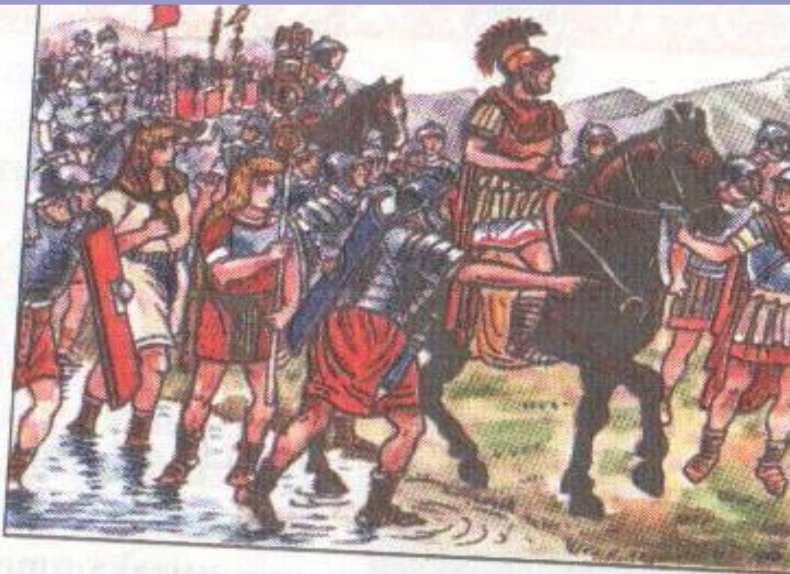
Переход Цезаря через Рубикон