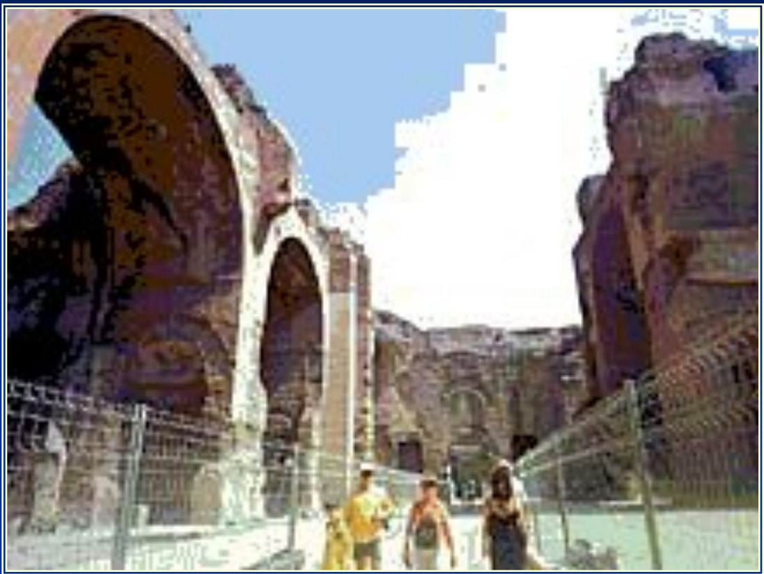
■ Термы Каракалла.