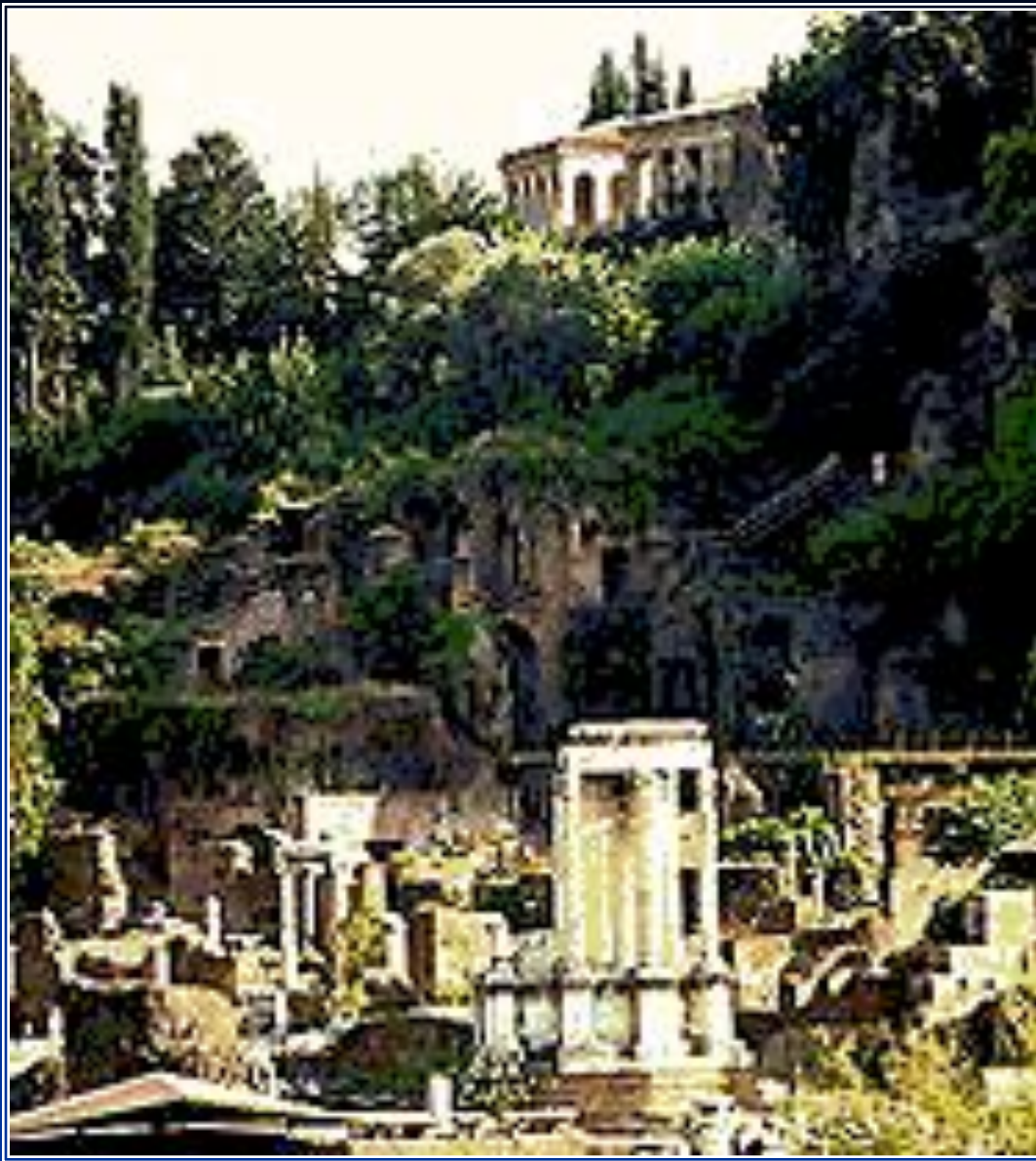
Палатинский холм. Форум Романум.