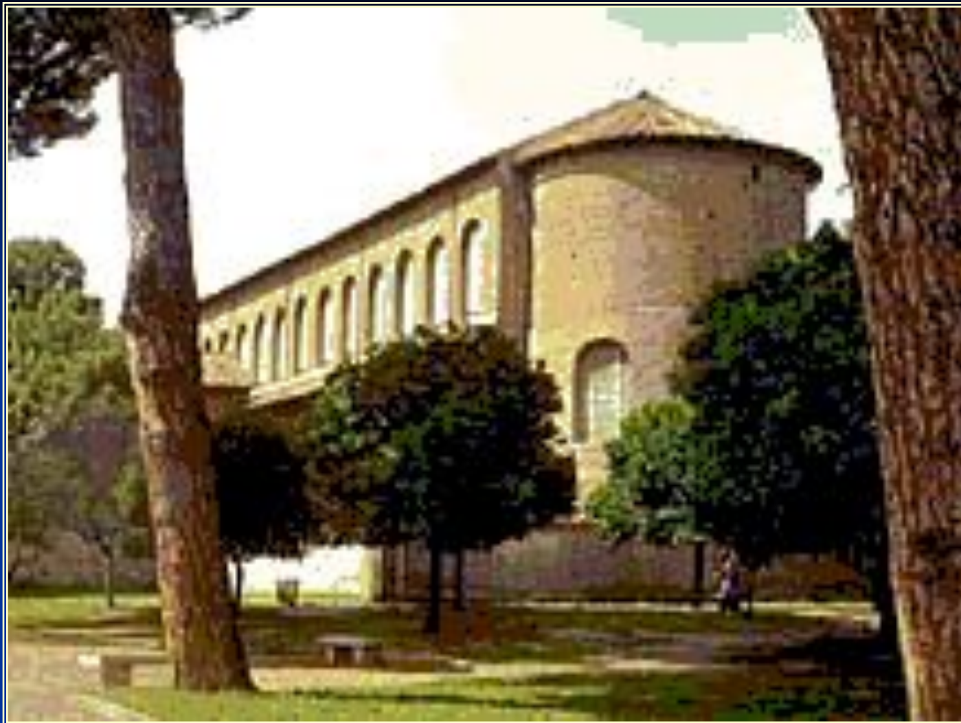
■ Церковь Санта-Сабина.