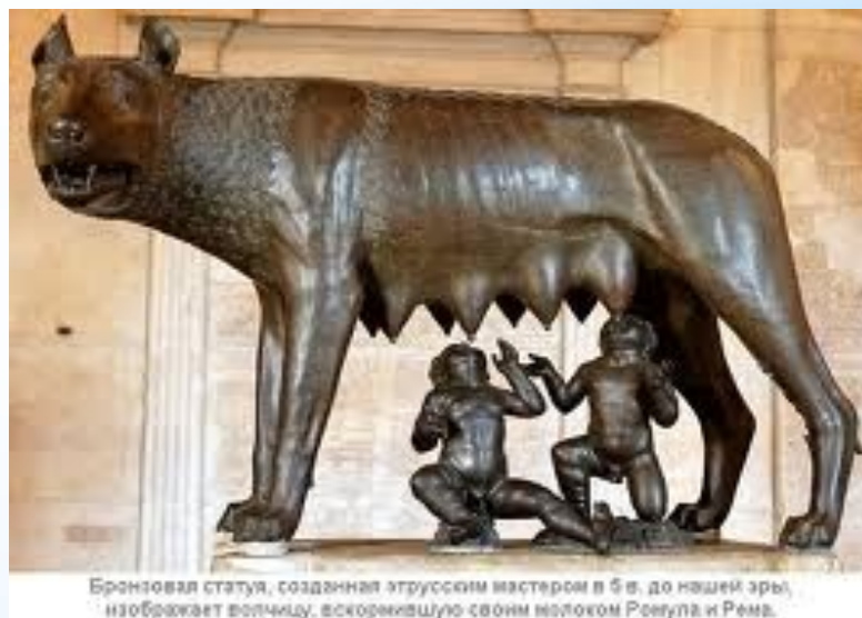
Бронзовая статуя, созданная этрусским мастером в 5 в. до нашей эры, изображает волчицу, вскормившую своим молоком Ромула и Рея.