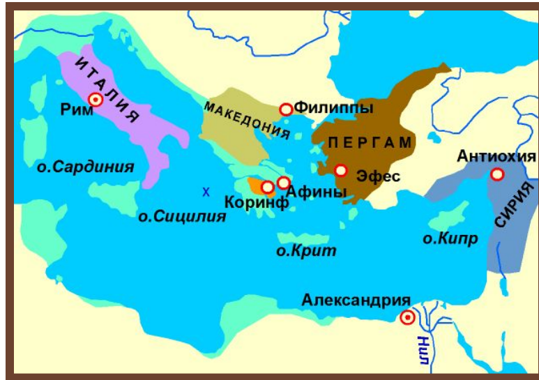
Рим и его провинции времен Республики

III вв. до н. э. – Рим подчинил всю Италию. Со-перничество с Карфагеном.