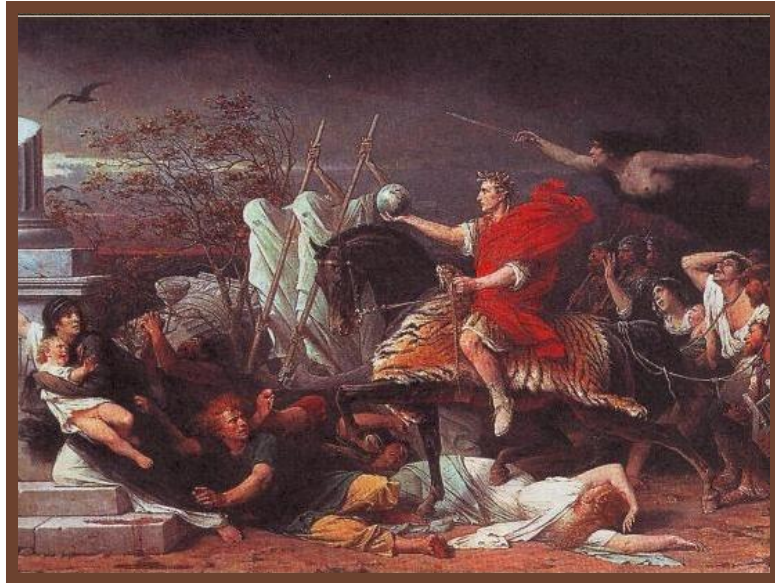
Ж. Л. Давид Триумф Цезаря

60-е гг. до н. э. – триумвират – Гай Юлий Цезарь, Гней Помпей, Марк Лициний Красс. Но: борьба за власть.