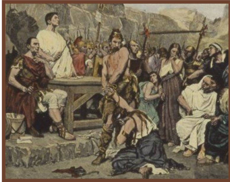
Продажа в рабство за долги