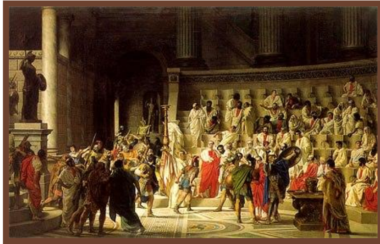
В римском Сенате

Во главе общины Сенат (родоплеменная знать – 100 патрициев).