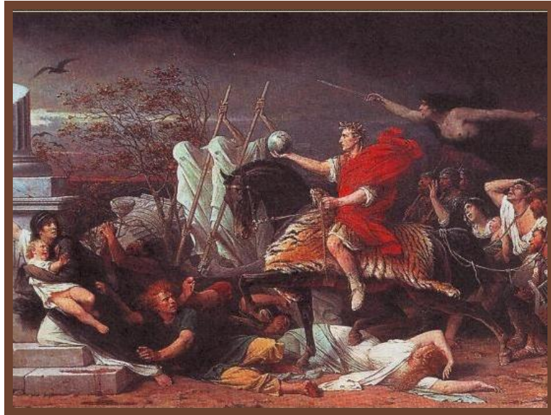
Ж. Л. Давид Триумф Цезаря

60-е гг. до н. э. – триумвират – Гай Юлий Цезарь, Гней Помпей, Марк Лициний Красс. Но: борьба за власть.