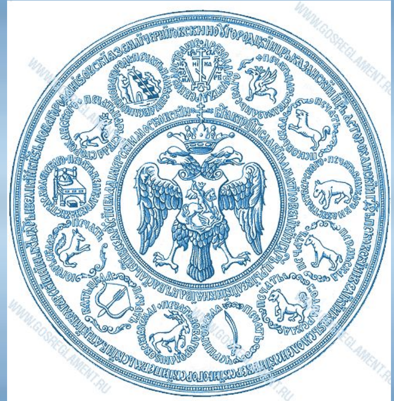
Печать Ивана Грозного