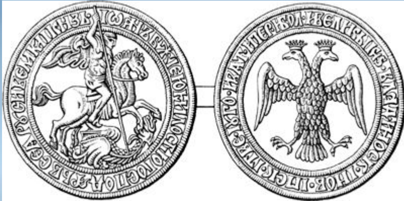
Монета Ивана III