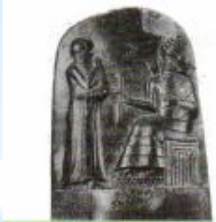
Стела с законами Хаммурапи