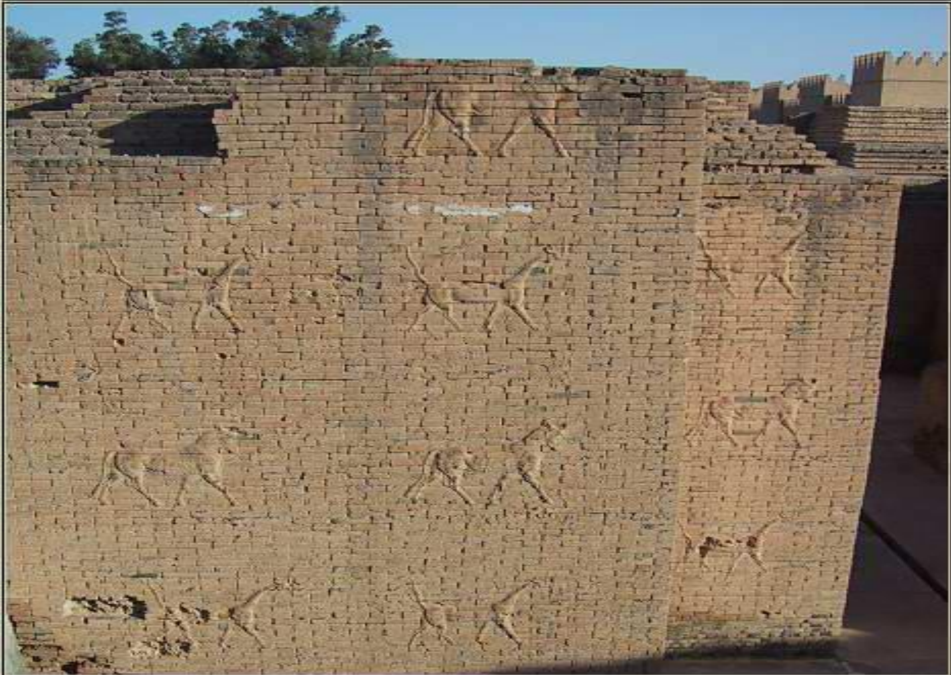
BABYLON, IRAQ: ONE OF THE BEST PRESERVED IN-SITU DECORATED WALLS