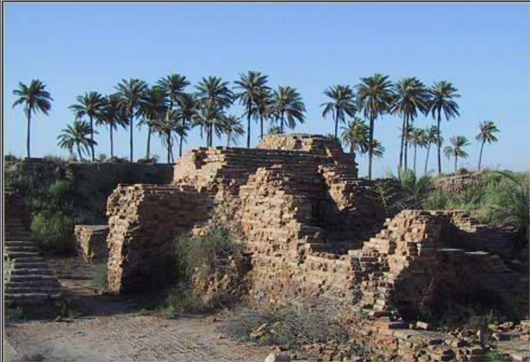
BABYLON, IRAQ: "REAL" RUINS, UNTAMPERED BY RECONSTRUCTION