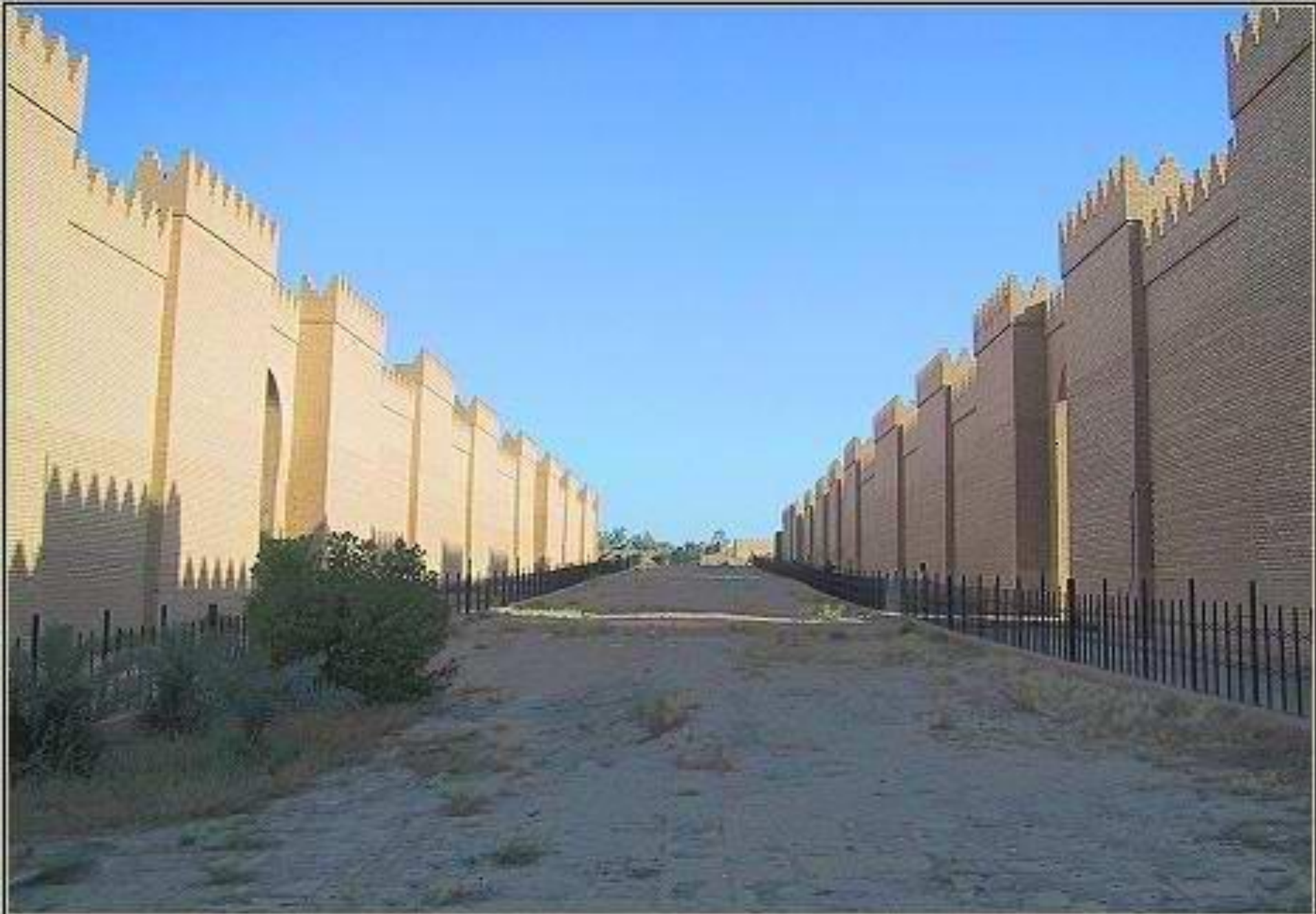
BABYLON, IRAQ: PROCESSION STREET (predominantly reconstructed)