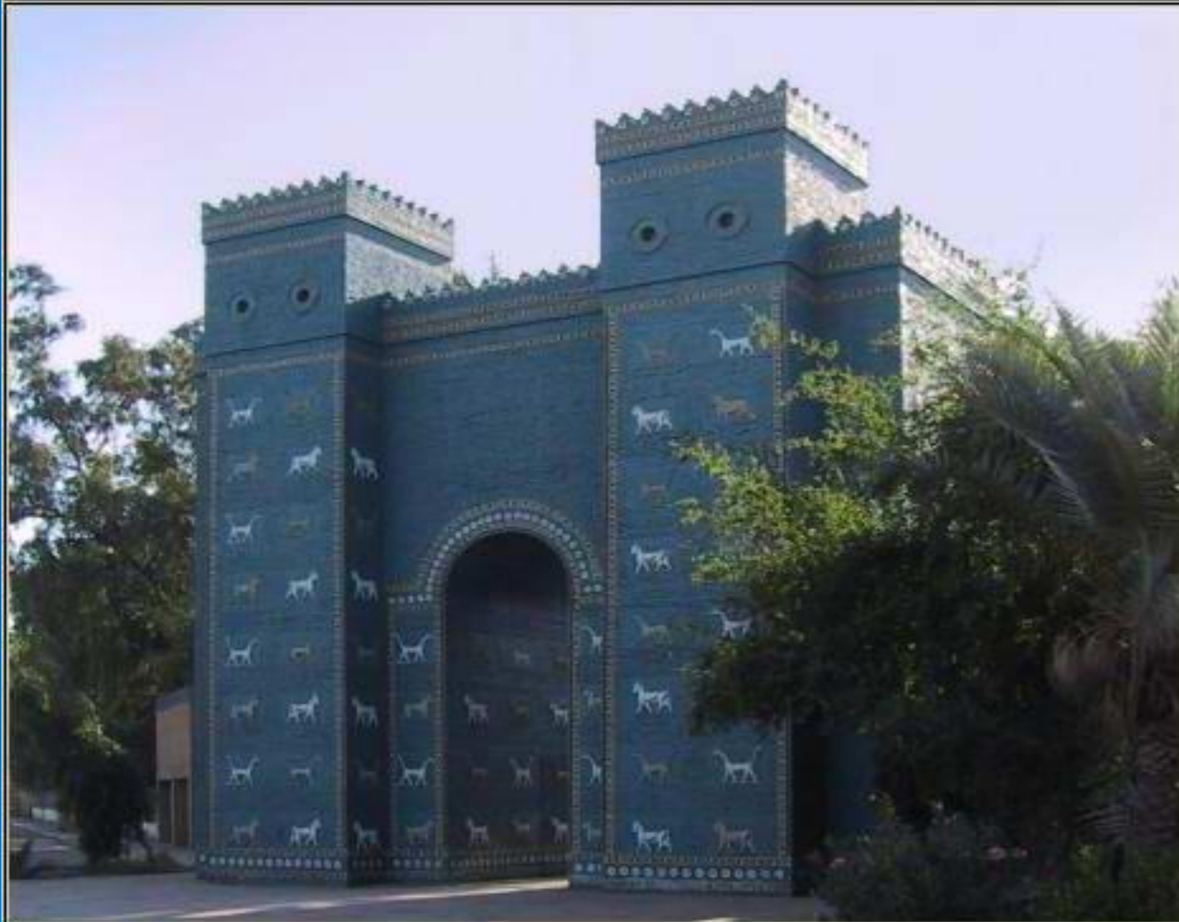
BABYLON, IRAQ: ISHTAR GATE (reconstructed)