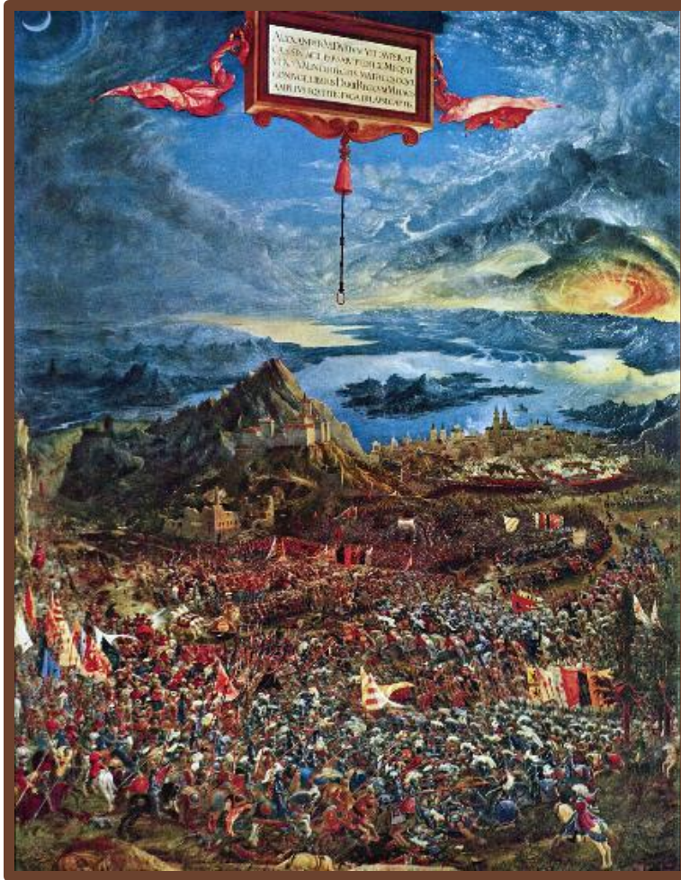
Альбрехт Альтдорфер. Битва Александра Македонского с Дарием

Дарий I – (522 – 486 гг. до н. э.) . 20 округов – Сатрапы (суд, налоги, дороги, каналы и т. д). Армия – военачальник. Единая монета – золотой дарик.