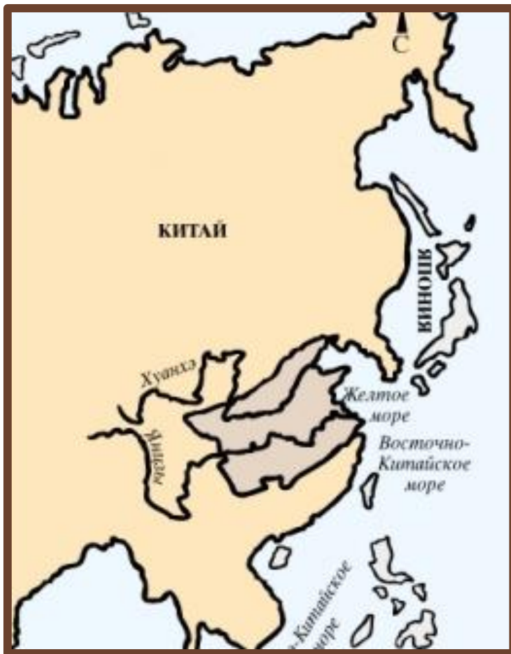
Китай во времена Чжоу

III – II тыс. до н. э. – зарождение государств.