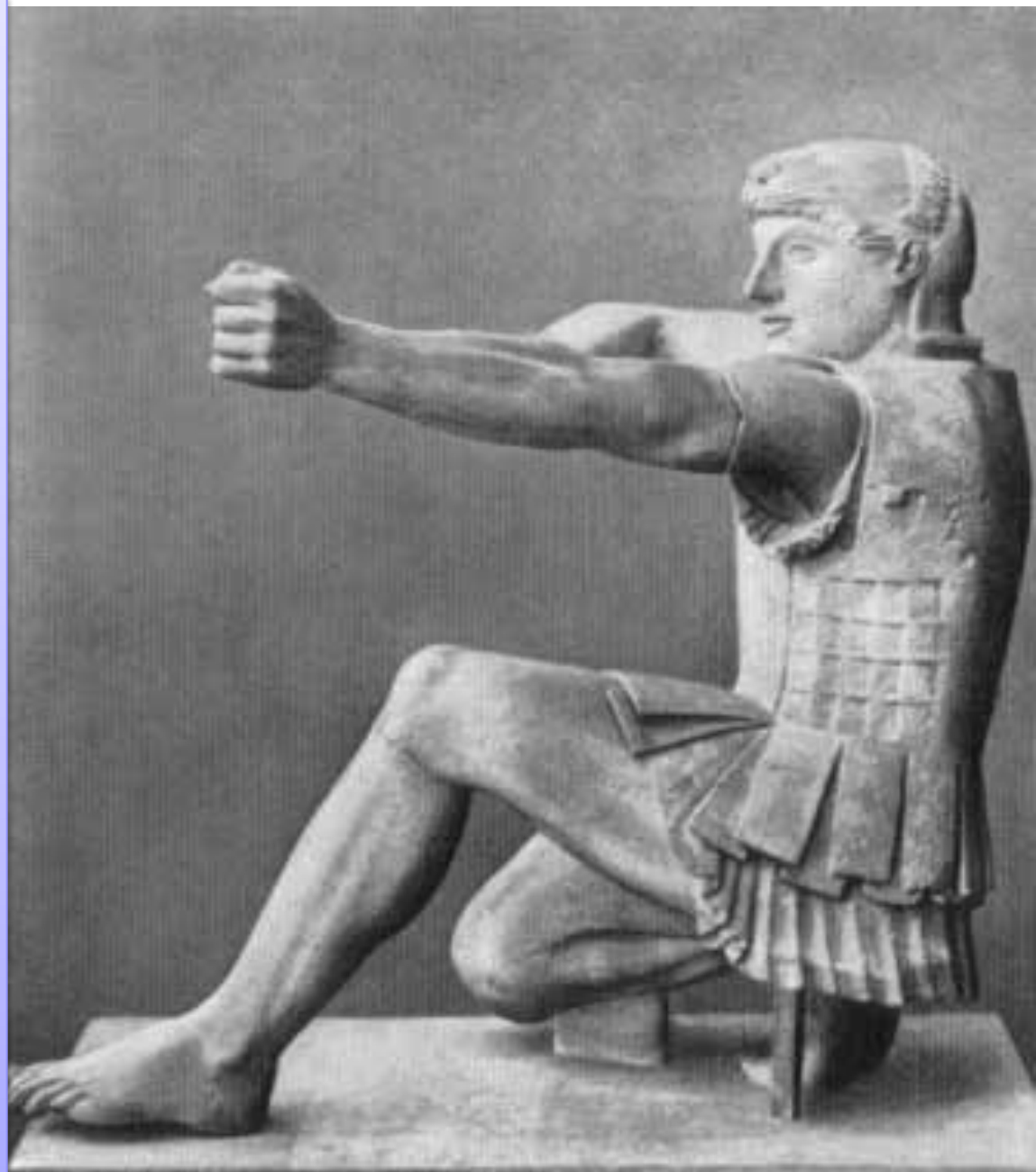
Воин натягивающий тетиву Скульптура Греция классический период