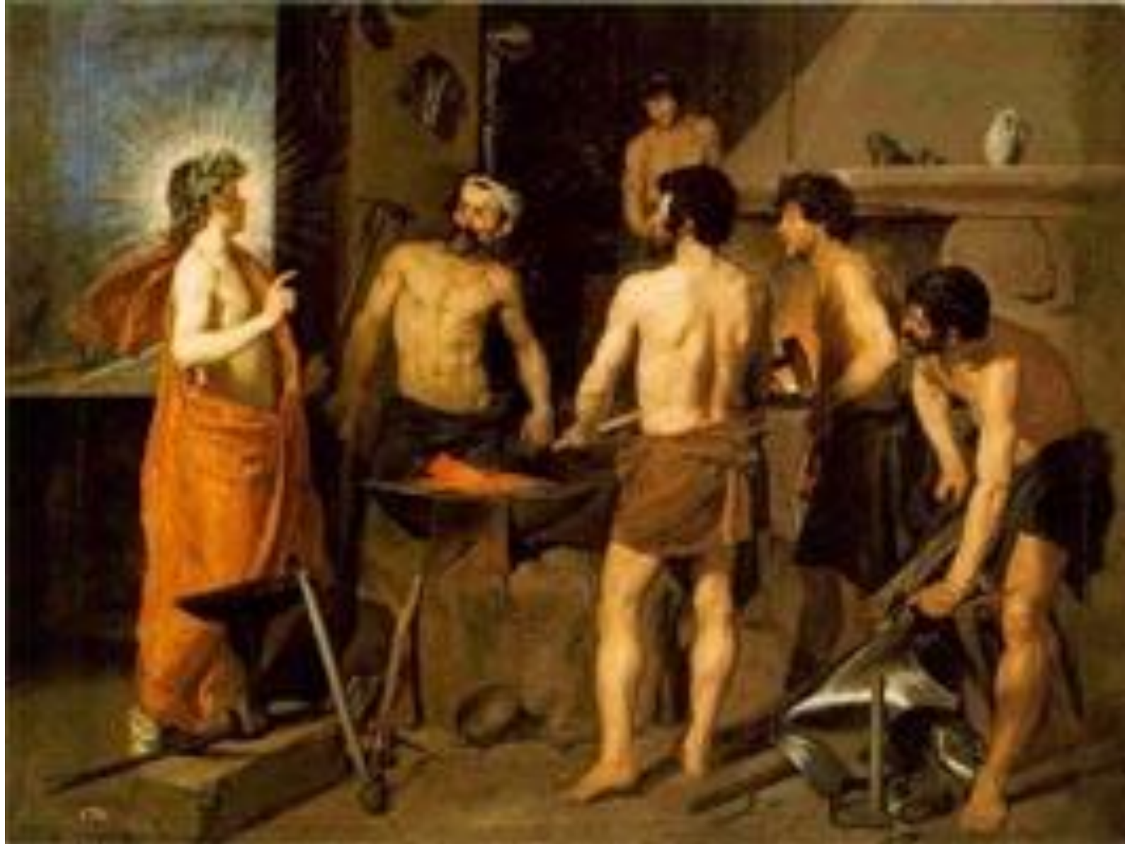
Кузница Вулкана Диего Веласкес, 1630 г. Мадрид, музей Прадо