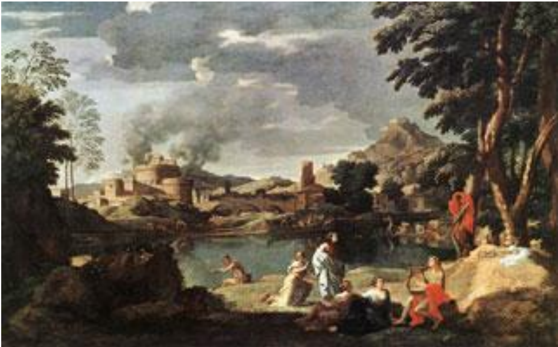
Пейзаж с Орфеем и Эвридикой Никола Пуссен, 1648 г. Париж, Лувр