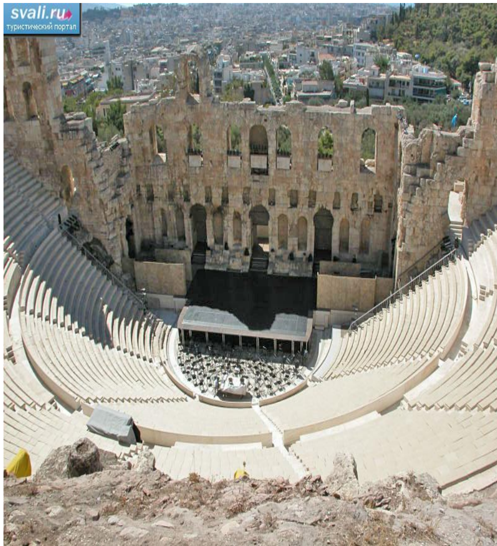
Парфенон. Акрополь а Афинах