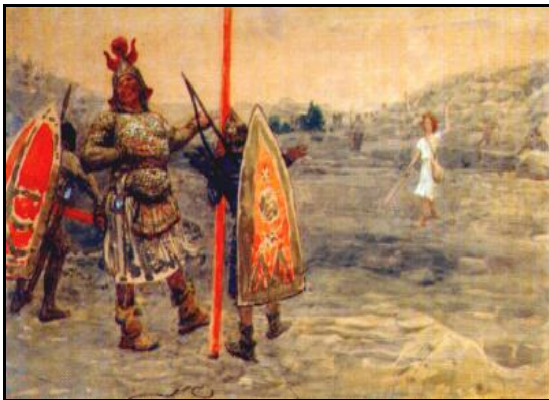
И.Репин. Давид и Голиаф

Свою власть и правление Давид передал своему сыну Соломону по наследству.