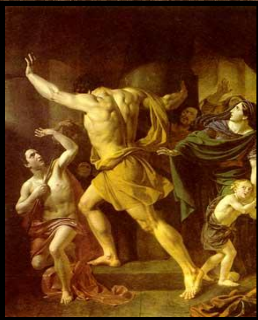
Самсон разрушает храм филистимлян.

Один из евреев Самсон-обладал огромной силой. Он полюбил красавицу Далилу и та узнала, что его сила кроется в волосах. Спящего Самсона остригли и связали. Он был ослеплен и брошен в темницу. Филистимляне устроили пир и стали издеваться над Самсоном. Но его волосы уже отрасли. Самсон схватился за колонны и обрушил здание.