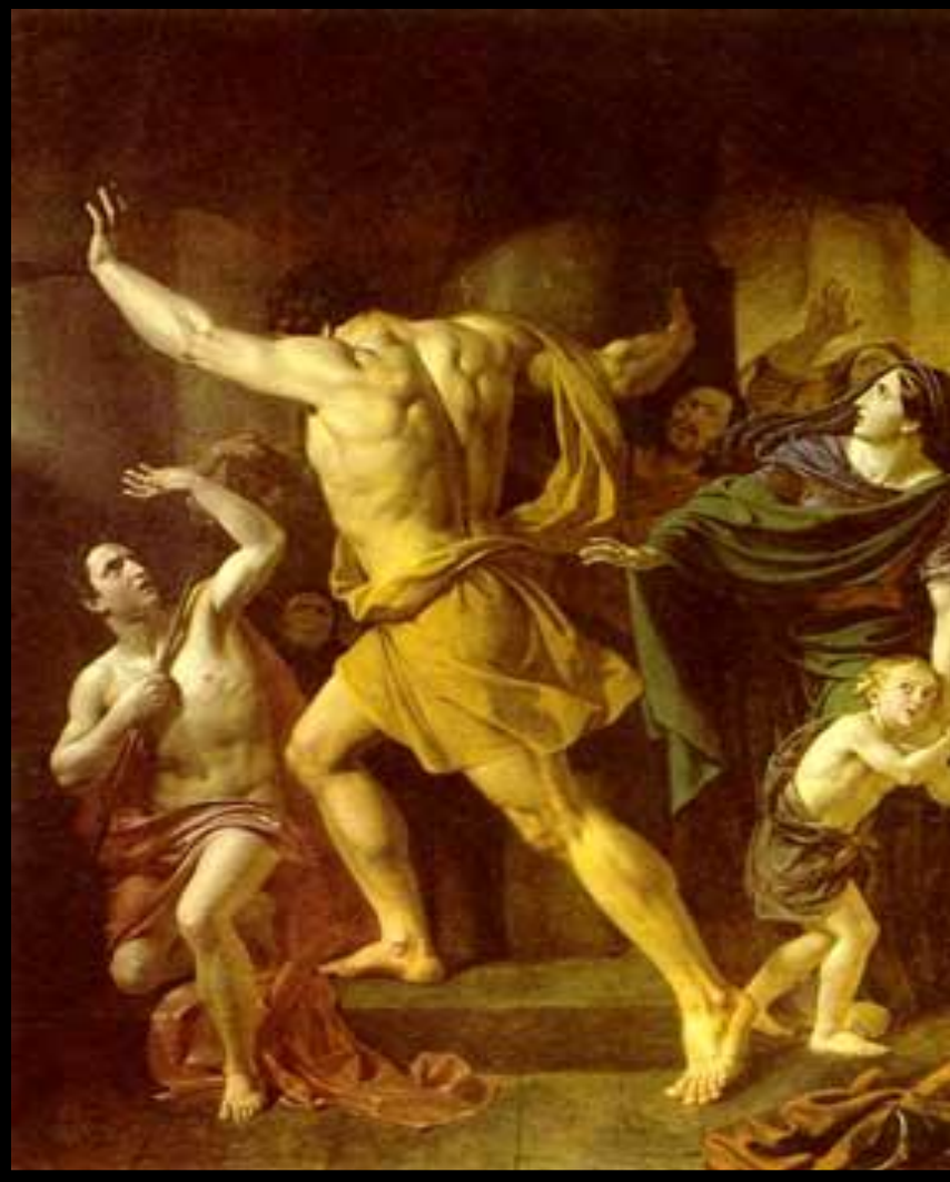
Самсон разрушает храм филистимлян.

Один из евреев Самсон-обладал огромной силой. Он полюбил красавицу Далилу и та узнала, что его сила кроется в волосах. Спящего Самсона остригли и связали. Он был ослеплен и брошен в темницу. Филистимляне устроили пир и стали издеваться над Самсоном. Но его волосы уже отрасли. Самсон схватился за колонны и обрушил здание.