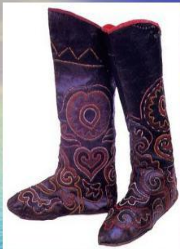
Сапоги из сафьяна

Они шили обувь, одежду, делали украшения.