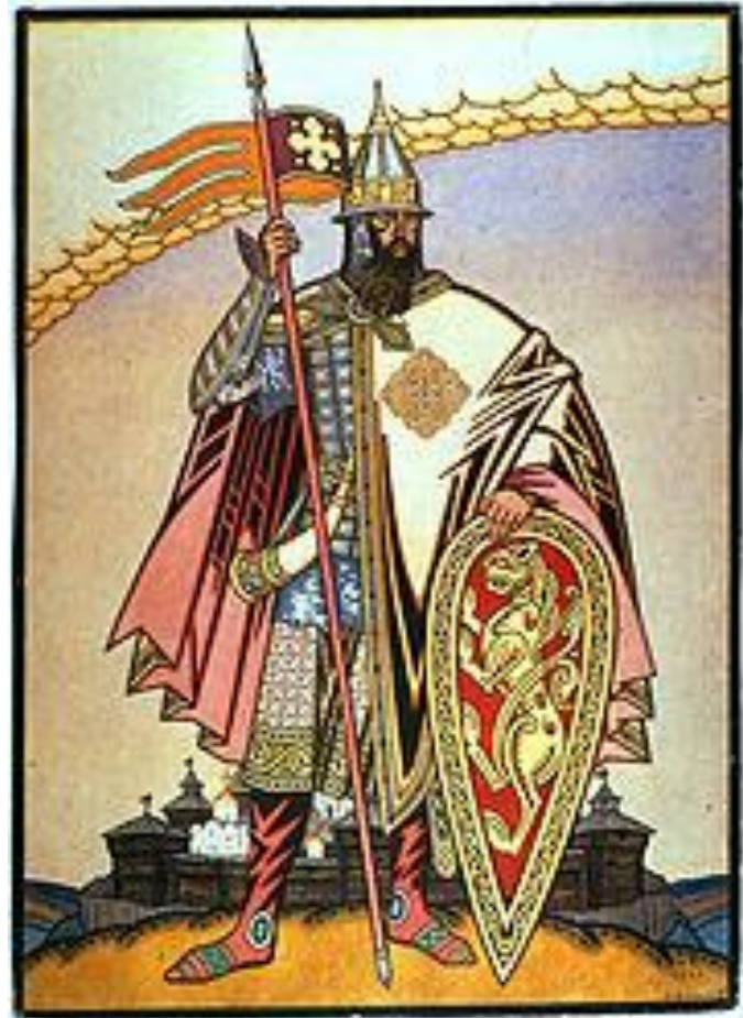
И. Я. Билибин. Князь Игорь. 1929

Игорь Святославич (1150 — 1202), новгород-северский князь с 1178, черниговский с 1198, сын Святослава Ольговича, князя черниговского.