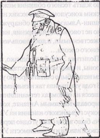
Проектъ художника Кишиневскаго. (пограма)

Иван Билибин - русский художник, книжный иллюстратор