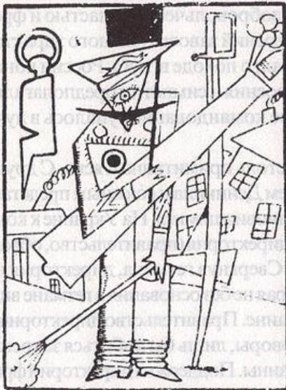
Проектъ художника Бурлюка. Давида