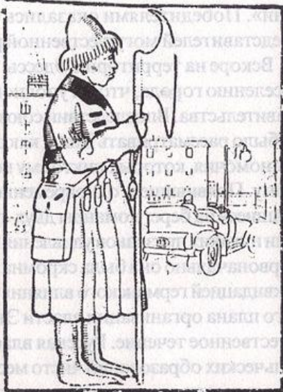
Проект художника Ивана Билибина.