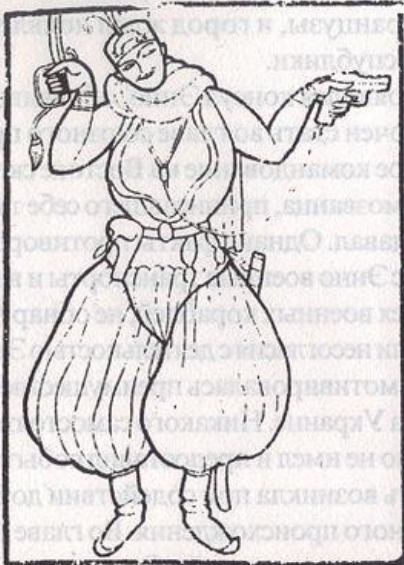
Проектъ художника Бакста. Льва