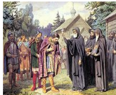
Благословение Д.Донского Сергием Радонежским на битву с татарами.