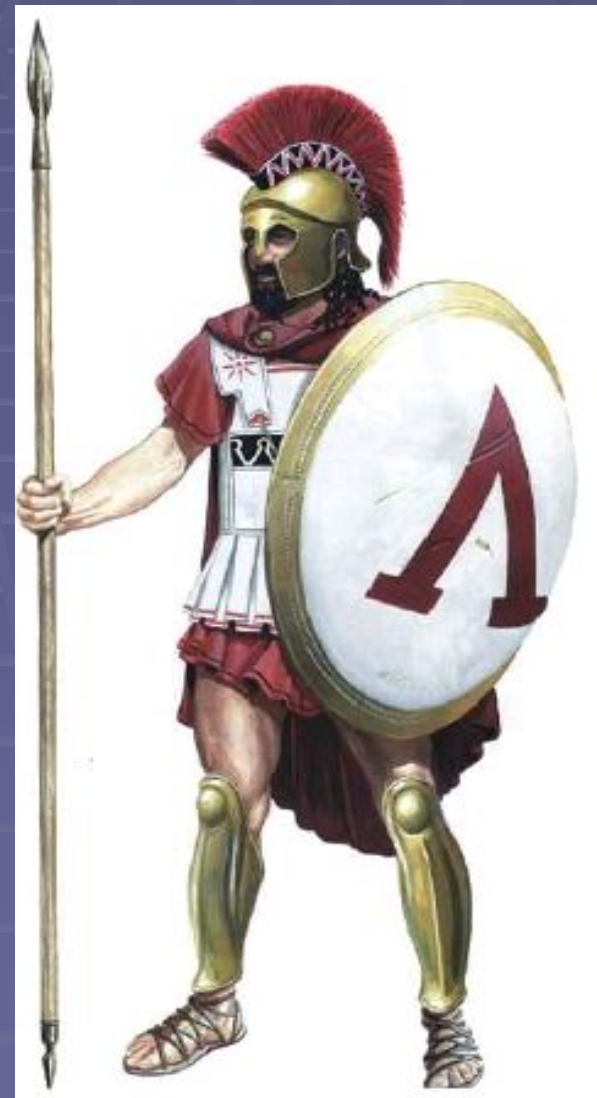
Спартанский ВОИН →