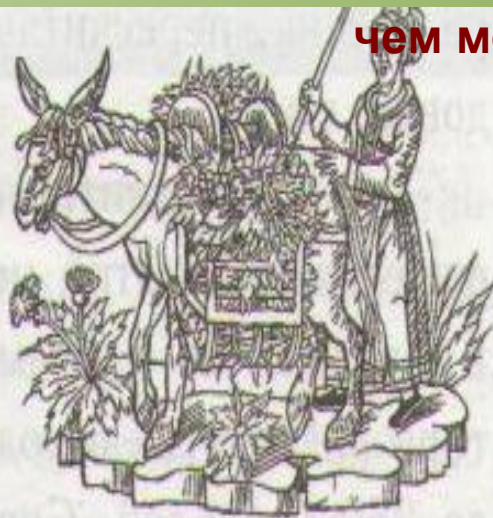
Торговка овощами со своим ослом. Гравюра на дереве. XVI в.