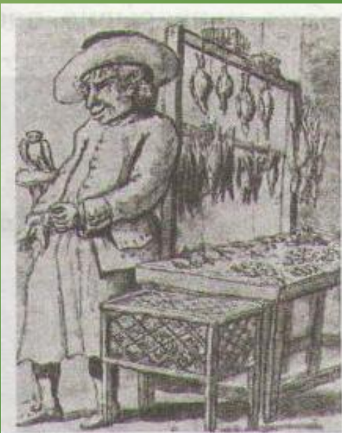
Торговец дичью вразнос в Риме