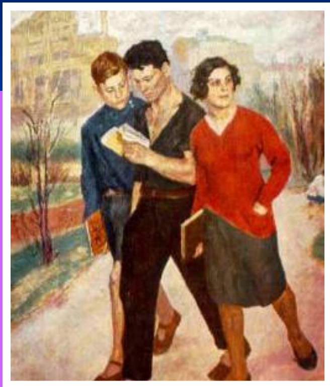
Б.Иогансон. Рабфак идет!