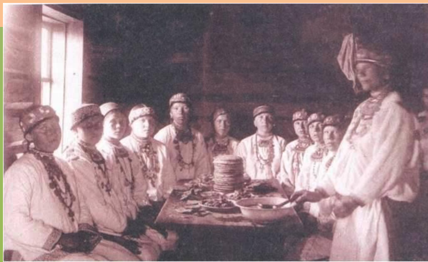
На третий день Троицы. Фотография начала XX в.