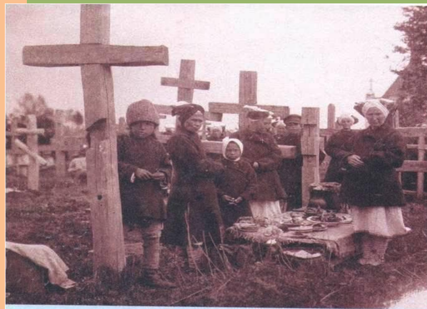
День поминовения усопших. Мордва-мокша Пензенской губернии