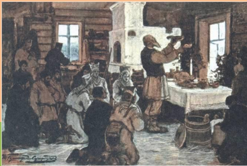
Моление в доме мордвина. Художник И. Горюшкин- Сорокопудов