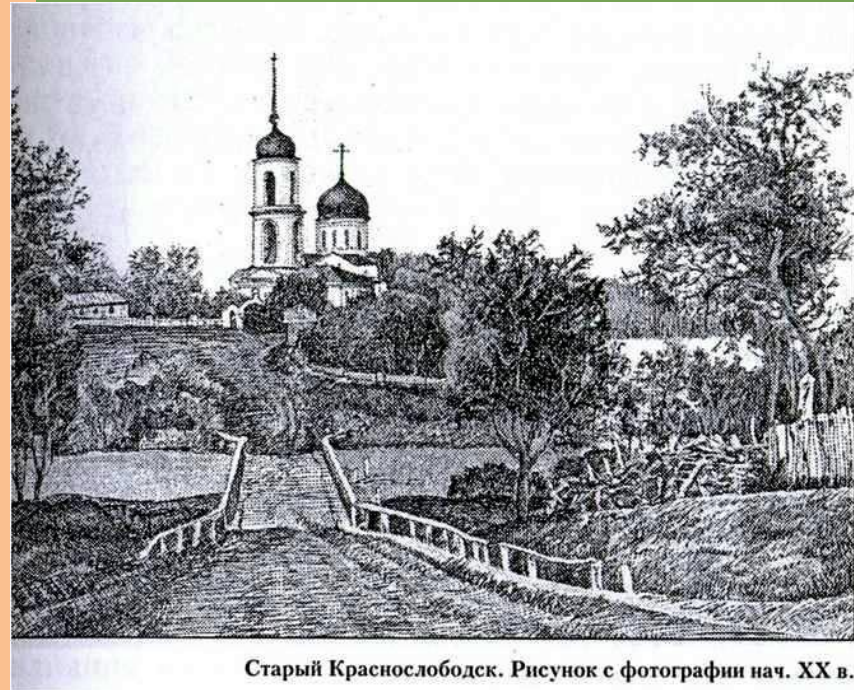
Старый Краснослободск. Рисунок с фотографии нач. XX в.