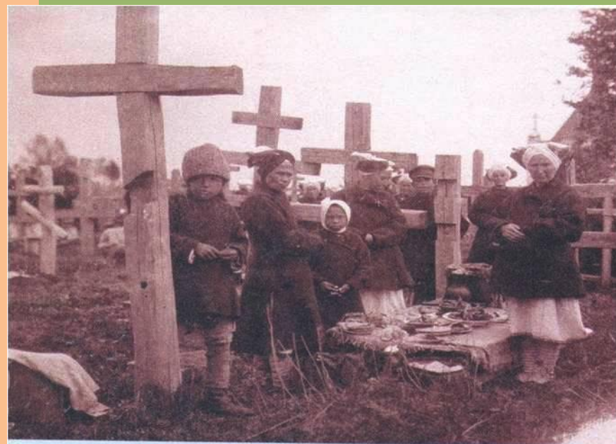
День поминовения усопших. Мордва-мокша Пензенской губернии