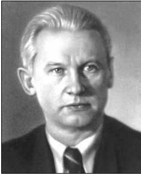
А. Фадеев, «Разгром»