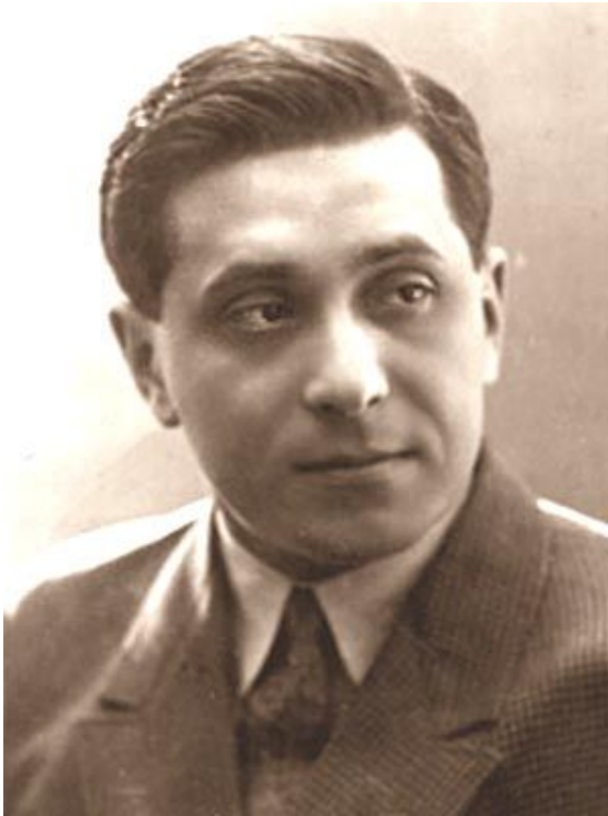
рассказы М. Зощенко,