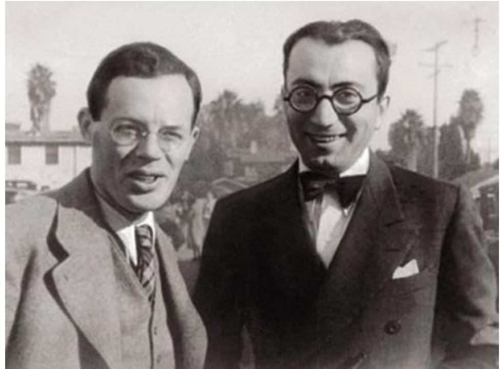
романы И. Ильфа и Е. Петрова «Двенадцать стульев», «Золотой теленок».

Расцветает искусство политического плаката (Дели, Моор)