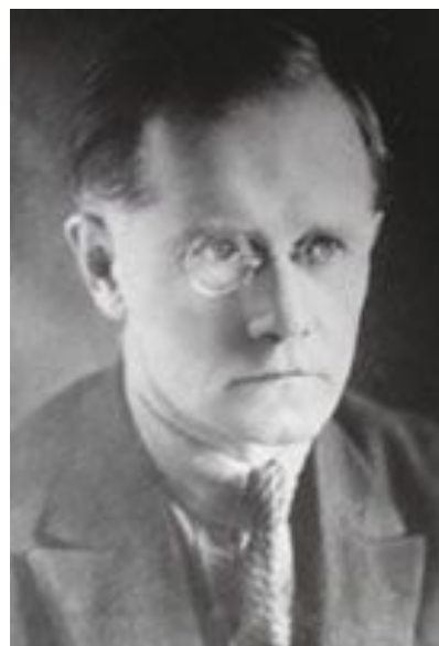
А. К. Гастев