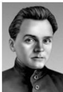
Д. Фурманов «Чужбина»