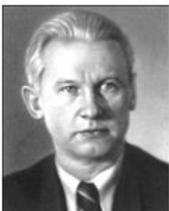
А. Фадеев «Разгром»

В годы НЭПа было создано много талантливых произведений писателями нового поколения