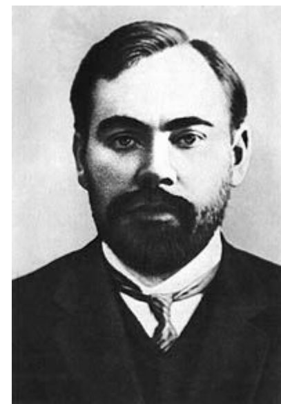
А. А. Богданов

Пролеткульт (Пролетарские культурно-просветительные организации) — массовая культурно-просветительская и литературно-художественная организация пролетарской самодеятельности при Наркомате просвещения, существовавшая с 1917 по 1932 год.