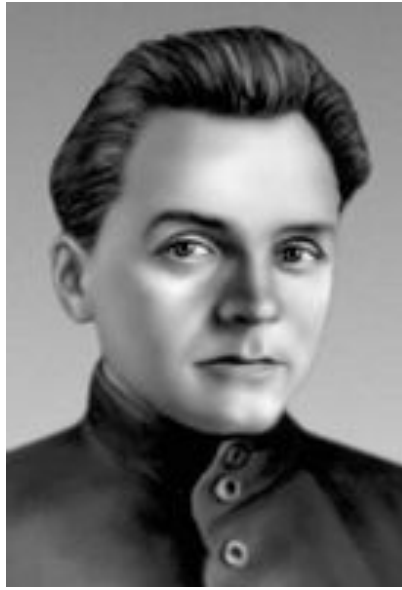
Д. Фурманов «Чапаев»