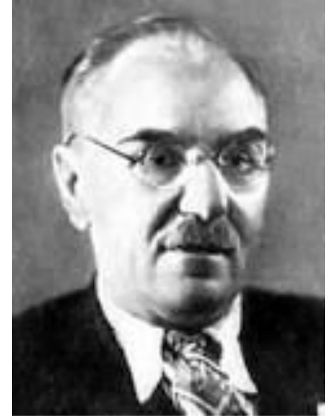
К. Тренев «Любовь Яровая»