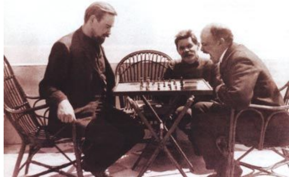
А. А. Богданов, М. Горький, В. Ульянов-Ленин