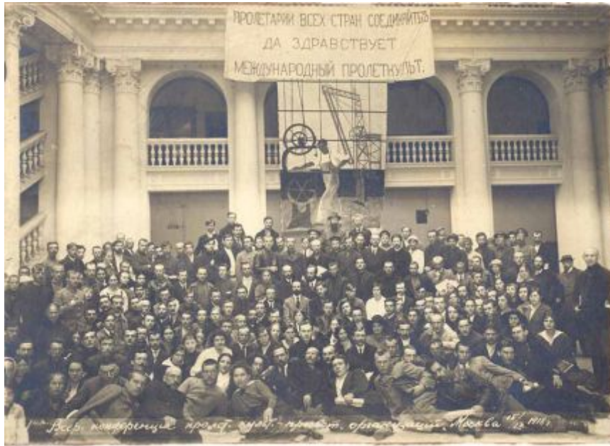
Участники 1-го съезда Пролеткульта

Создать «свою» собственную «пролетарскую» культуру с нуля