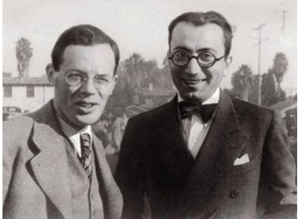
романы И. Ильфа и Е. Петрова «Двенадцать стульев», «Золотой теленок».

Расцветает искусство политического плаката (Дели, Моор)