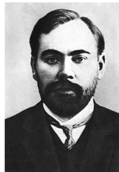
А. А. Богданов

Пролеткульт (Пролетарские культурно-просветительные организации) — массовая культурно-просветительская и литературно-художественная организация пролетарской самодеятельности при Наркомате просвещения, существовавшая с 1917 по 1932 год.