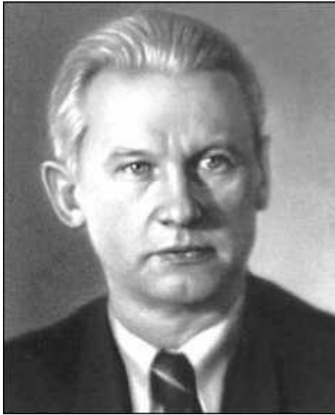
А. Фадеев, «Разгром»