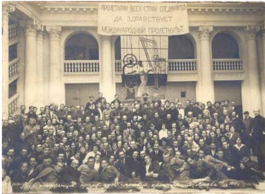
Участники 1-го съезда Пролеткульта

Создать «свою» собственную «пролетарскую» культуру с нуля