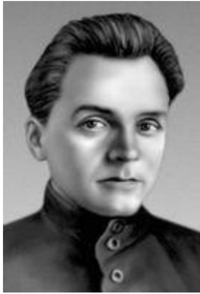
Д. Фурманов «Чапаев»