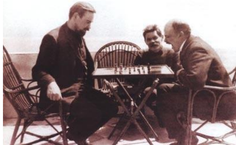
А. А. Богданов, М. Горький, В. Ульянов-Ленин