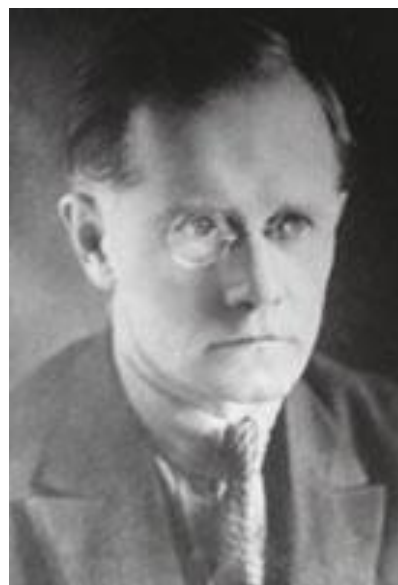
А. К. Гастев