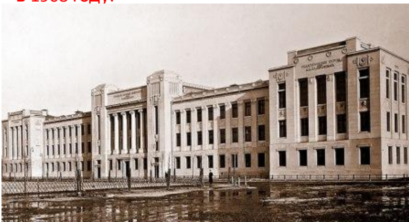
Университет Шанявского А.Л.

государственный гуманитарный университет