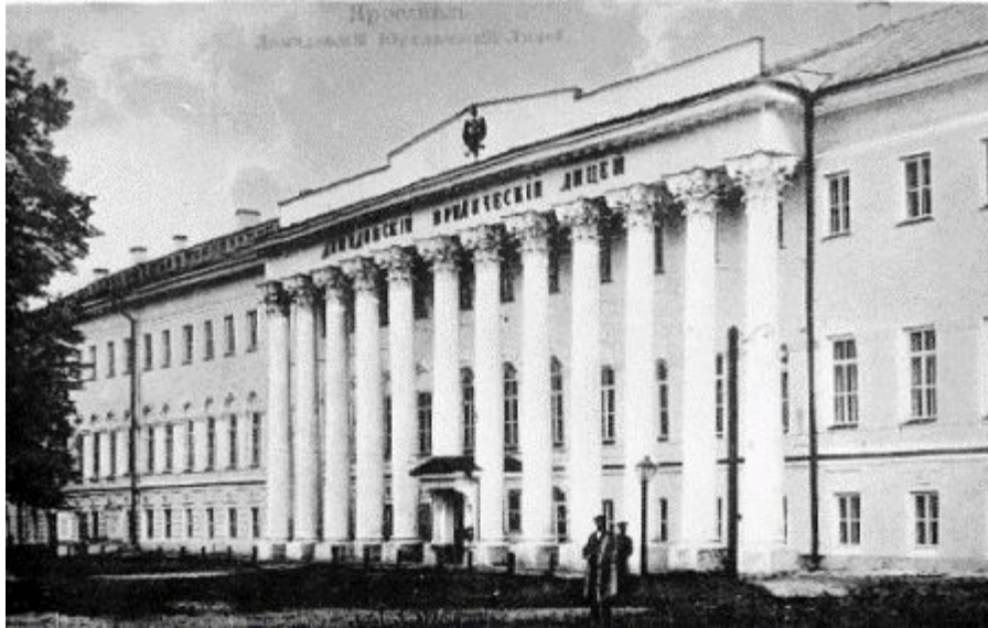
Демидовский юридический лицей

Представитель знаменитой династии предпринимателей Демидовых — Павел Григорьевич Демидов (1738—1821) посвятил себя и делу образования. В 1802 году император Александр I издал Манифест об учреждении министерств и вместе с ним — призыв к общественности России оказать посильную помощь пожертвованиями на дело образования. Одним из первых откликнулся Демидов. В 1803 году он начал хлопотать об учреждении в Ярославле университета. В том же году он сделал пожертвования на содержание профессоров и другие нужды университета и 100 тысяч рублей на содержание беднейших студентов и отправку достойнейших из них в лучшие университеты Европы.