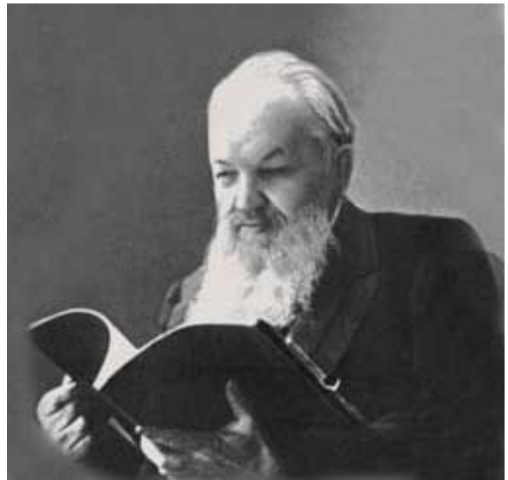
А. С. Суворин (1835-- 1912)

С 1904 г. было выпущено 40 «Сборников товарищества "Знание"», включавших произведения выдающихся писателей-реалистов М. Горького, А.И. Куприна, И. А. Бунина и др.