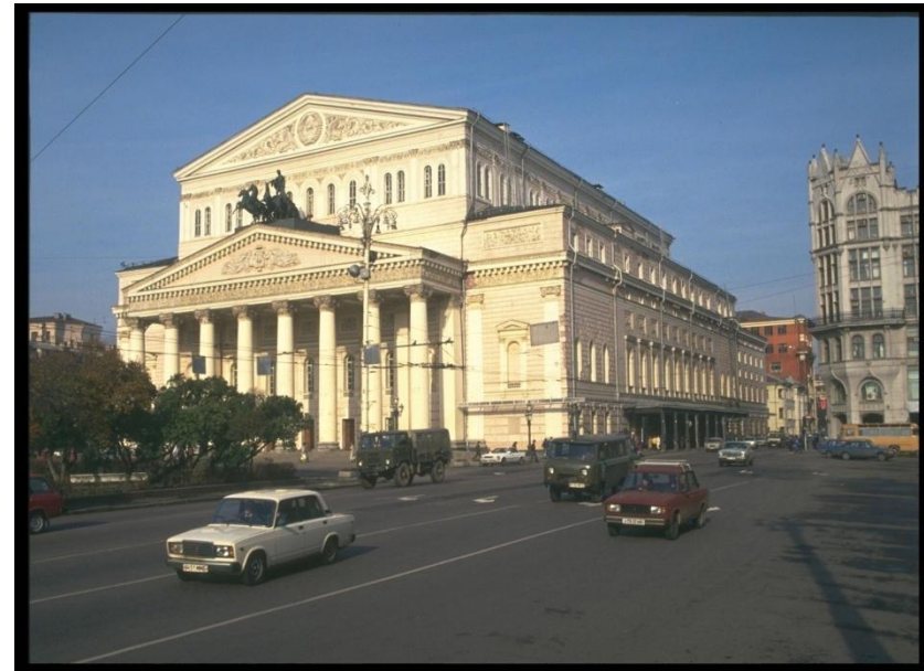
Большой театр г.Москва, 90-ые года