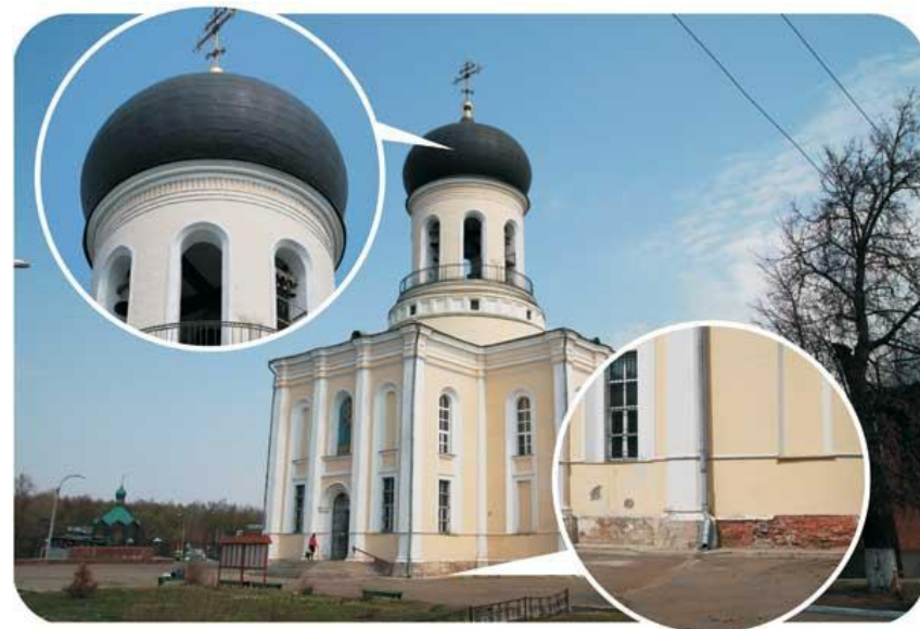
Никольский собор г.Наро-Фоминск