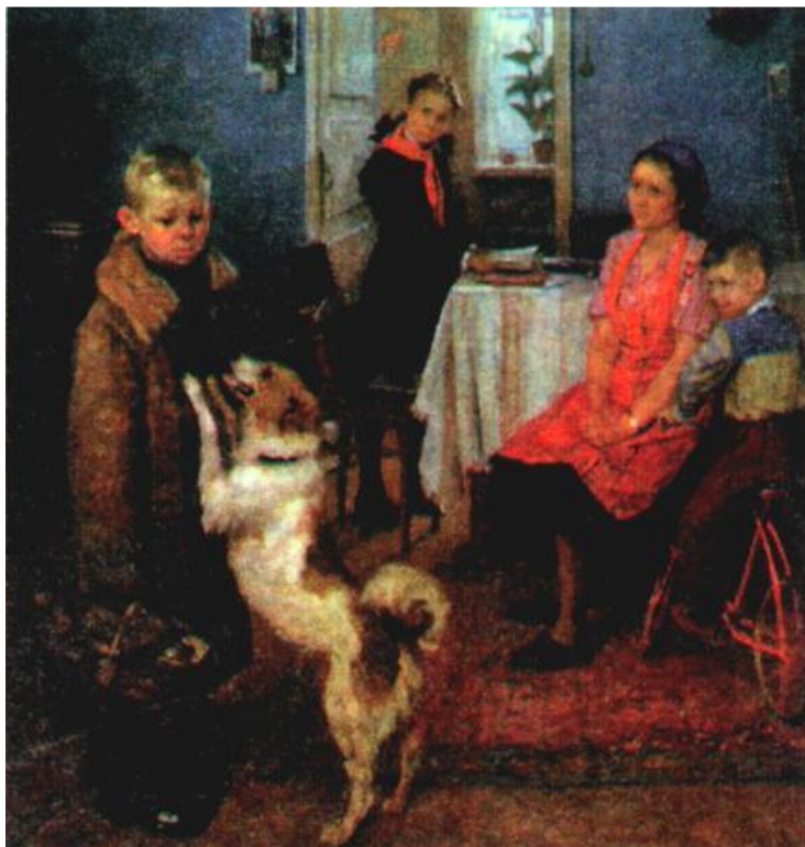
Ф.Решетников. Опять двойка.

После войны быстрыми темпами шло восстановление системы образования. в 1950 г. в стране насчитывалось 222 тыс. школ. Расходы на образование выросли в 2,5 раза. Страна продолжила, прерванный войной переход ко всеобщему обязательному семи-летнему образованию. Восстановление экономики требовало квалифицированных специалистов, поэтому к 1947 г. был превзойден довоенный уровень ВУЗов и студентов. За 5 лет было подготовлено 650000 специалистов.