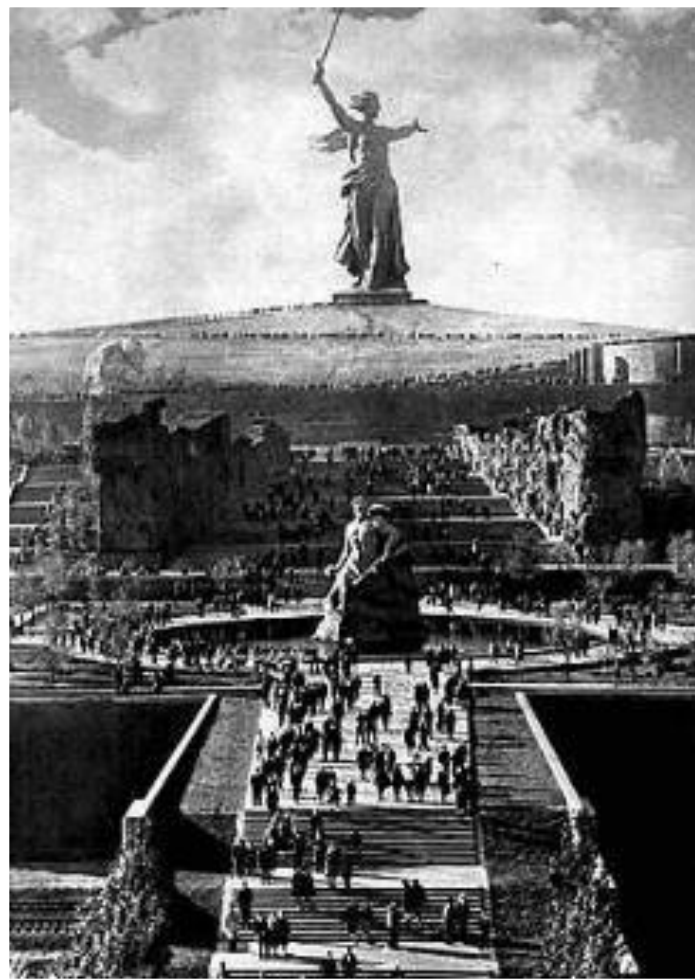
В. Вучетич. Комплекс на Мамаевом кургане.

Советский балет ставший лучшим в мире гордился М.Плисецкой, М.Ли епой, В.Васильевым, Н. Павловой, в то же время остались за границей и получили там признание Р.Нуриев, М. Барышников, А.Годунов. оперное искусство было представлено И. Архиповой, В.Атланотым, З.Соткилавой, Е. образцовой, Т. Синявской, Б. Штоколовым.