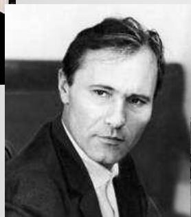
ШУКШИН Василий Макарович