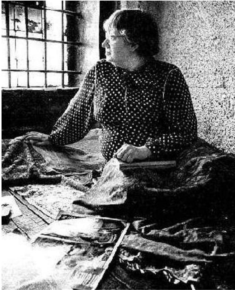
В.Новодворская в тюрьме.

Солженицын выступал за возрождение национального государства.