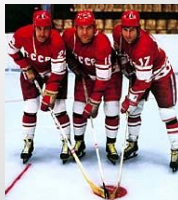
Б.Михайлов, Петров и Харламов