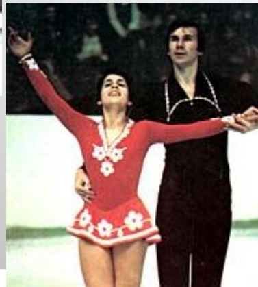
И.Роднина и А.Зайцев