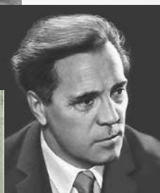
АСТАФЬЕВ Виктор Петрович