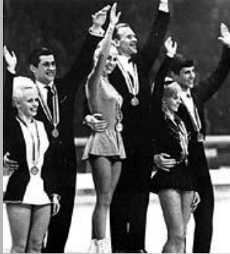
Парное катание: Л.Белоусова и О.Протопопов