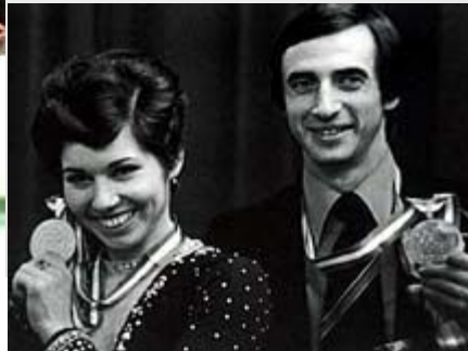
Л.Пахомова и А.Горшков