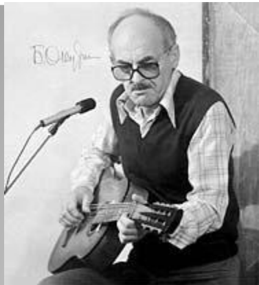
В.Высоцкий. Б.Окуджава. Ю.Ким.