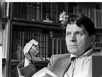
АБРАМОВ Федор Александрович