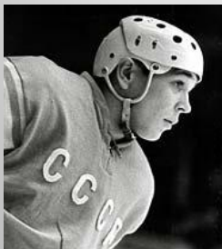
Александр Мальцев – один из лучших хоккеистов в мировом хоккее.