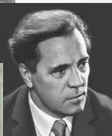
АСТАФЬЕВ Виктор Петрович