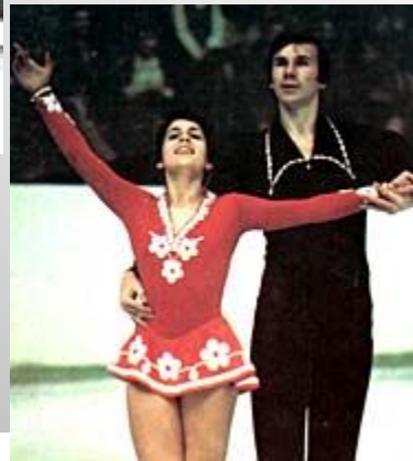
И.Роднина и А.Зайцев