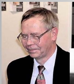
РАСПУТИН Валентин Григорьевич