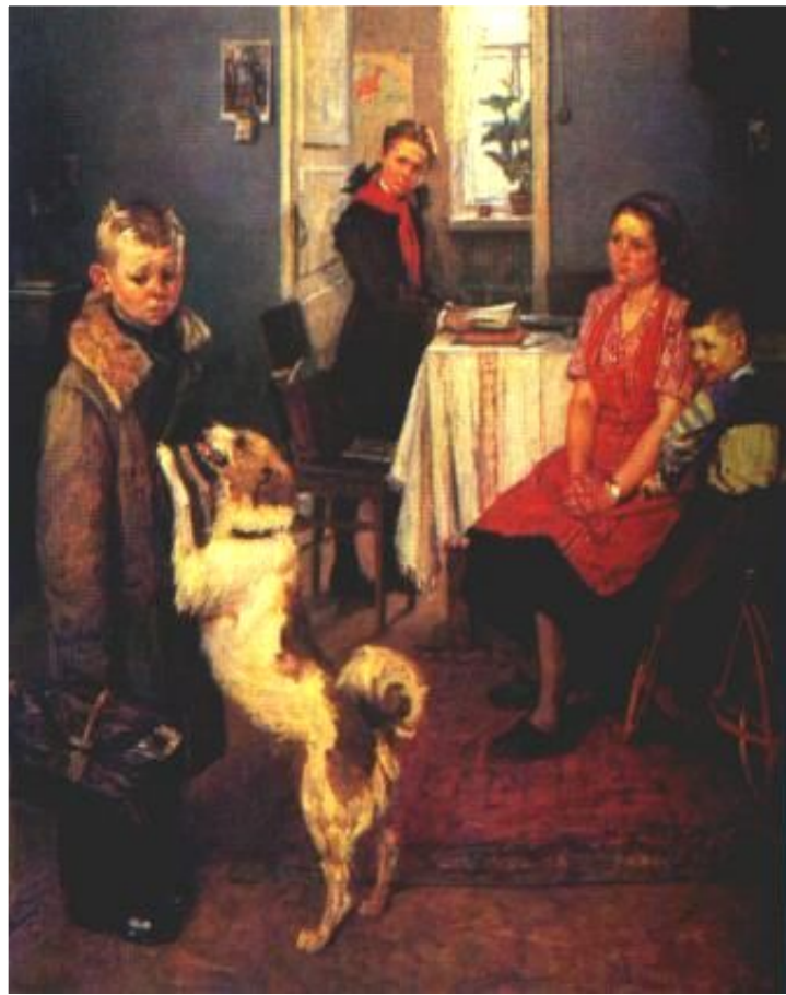
Ф.Решетников. Опять двойка!

В 50-е гг. началось обновление системы образования. Ликвидировалось раздельное обучение мальчиков и девочек. Открылись новые ВУЗы.