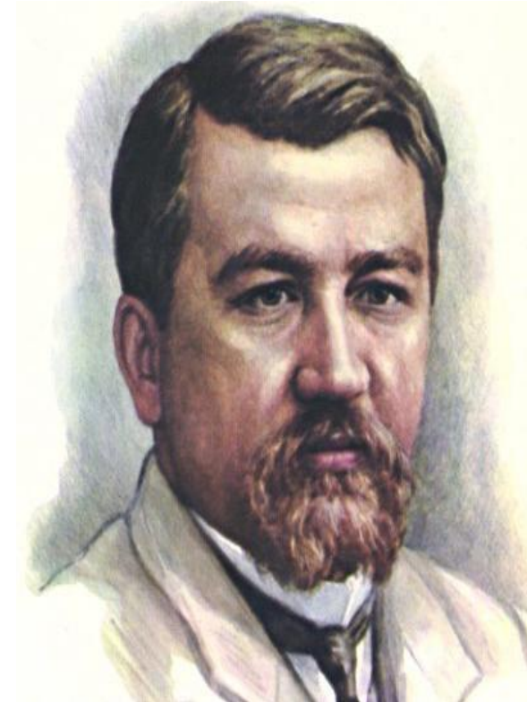
С.С. Прокофьев; М.И. Цветаева; М. Горький; А.И. Куприн