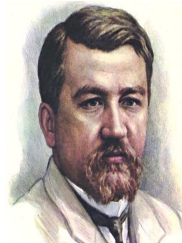
С.С. Прокофьев; М.И. Цветаева; М. Горький; А.И. Куприн