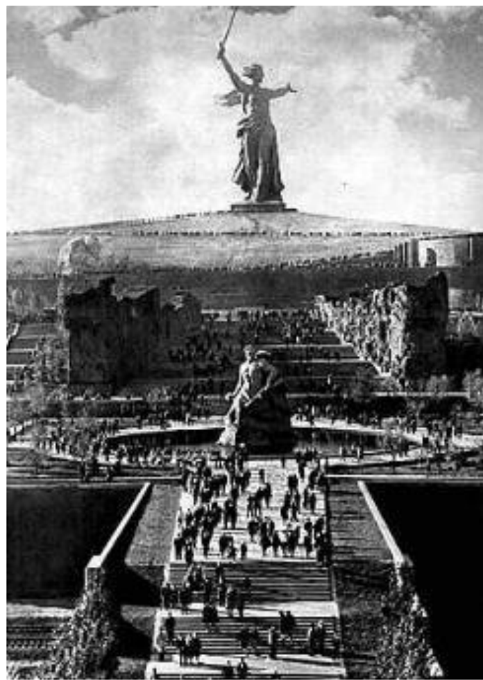
В. Вучетич. Комплекс на Мамаевом кургане.

Советский балет ставший лучшим в мире гордился М.Плисецкой, М.Ли епой, В.Васильевым, Н. Павловой, в то же время остались за границей и получили там признание Р.Нуриев, М. Барышников, А.Годунов. оперное искусство было представлено И. Архиповой, В.Атланотым, З.Соткилавой, Е. образцовой, Т. Синявской, Б. Штоколовым.