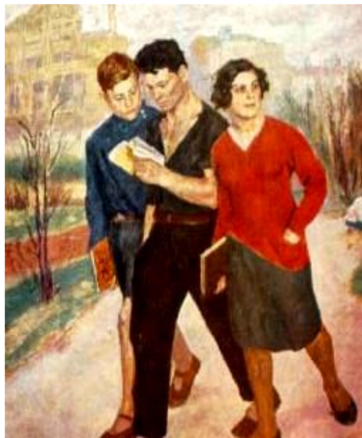
Б.Иогансон. Рабфак идет!

При поступлении в ВУЗы преимуществом пользовалась беднота. Для того чтобы рабочие и колхозники могли учиться в ВУЗах при них создавались рабочие факультеты. Государство обеспечивало выпускников рабфаков стипендиями и общежитиями.