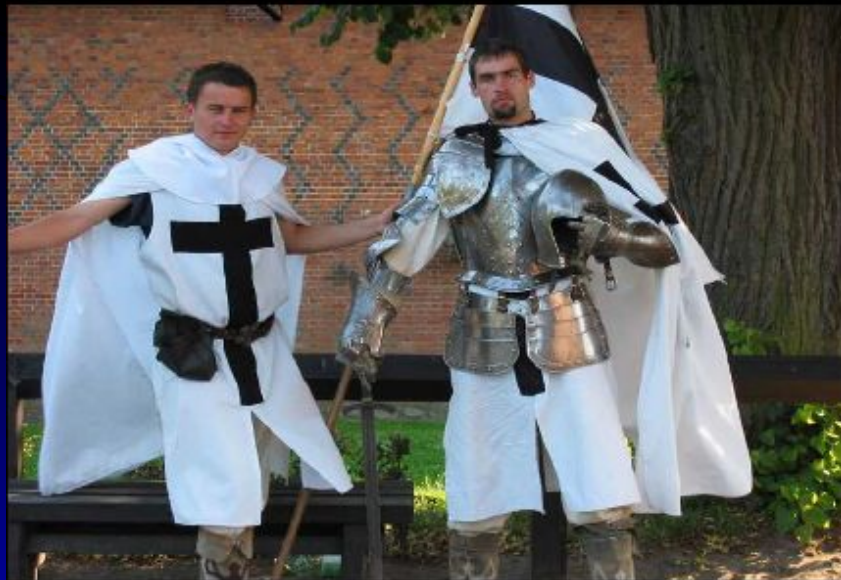
Шоур-реконструкция кавалерийцев Тевтонского ордена