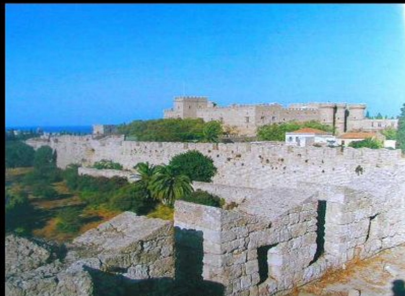
Замок ионнитов на Родосе