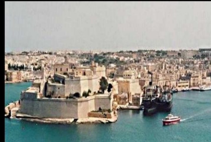
Крепость Святого Ангела на Мальте