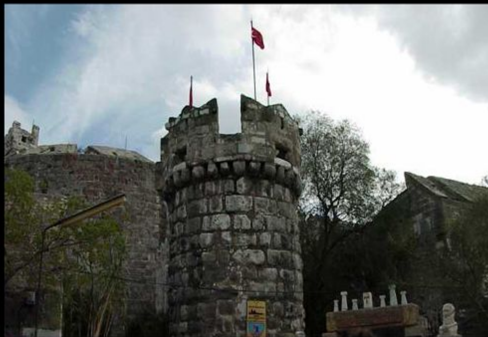
Замок госпитальеров в Бодруме