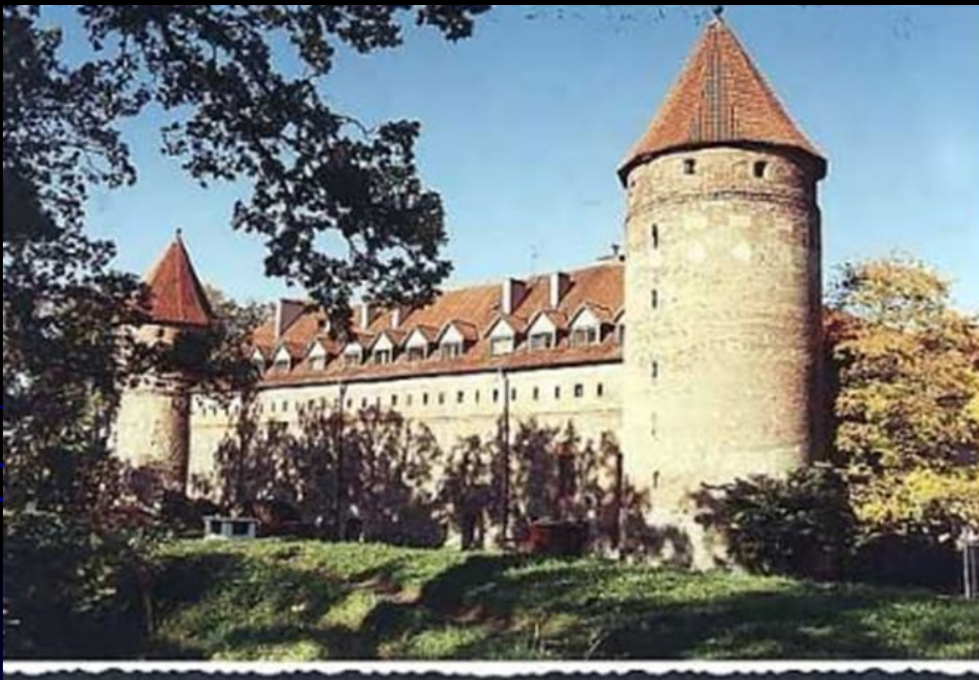
Тевтонский замок в Польше XIV века

Соединенными усилиями поляков, литовцев и представителей некоторых западнорусских княжеств в битве при Грюнвальде (1410г) орден был разгромлен и признал вассальную зависимость от Польши (1466г.). В 1525 году его владения в Прибалтике превращены в светское герцогство Пруссию.