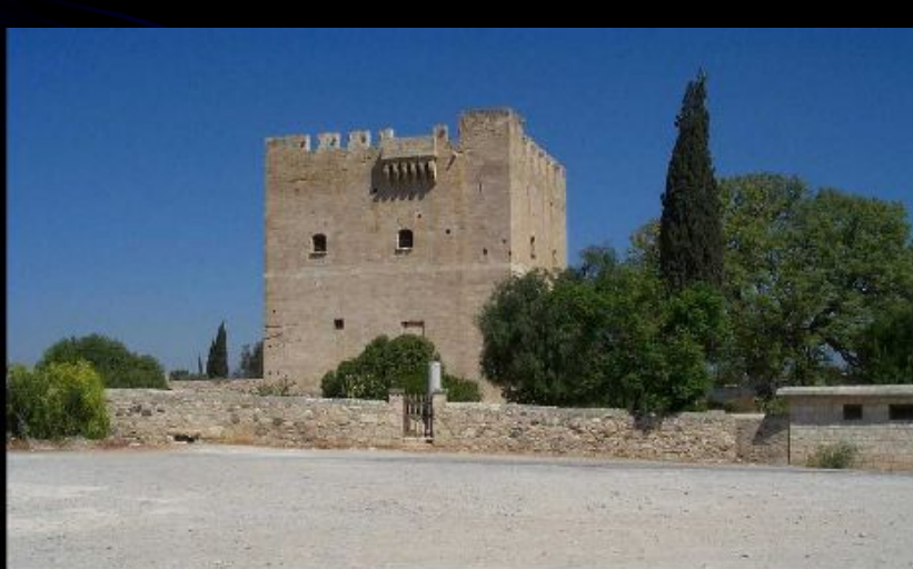
Замок на кипре, построенный тамплиерами