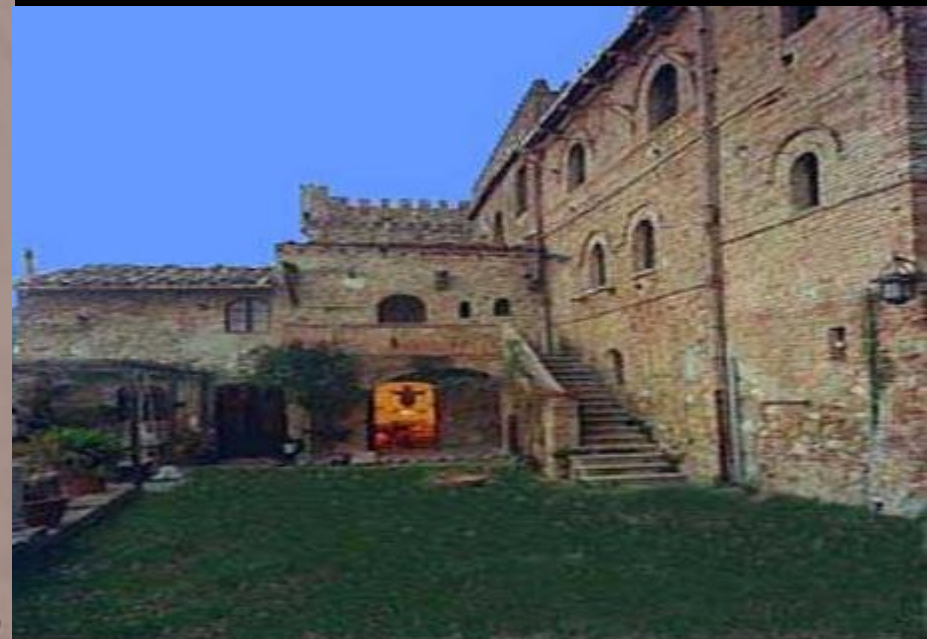
Двор замка тамплиеров в Италии XIII века

Еще одна печать тамплиеров — с изображением Церкви Гроба Господня.