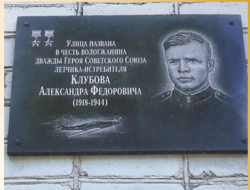
Мемориальная доска А.Ф.Клубову на спортивном комплексе «СпортАрт»

Соревнования, посвященные памяти дважды Героя Советского Союза, в центре «СпортАрт»