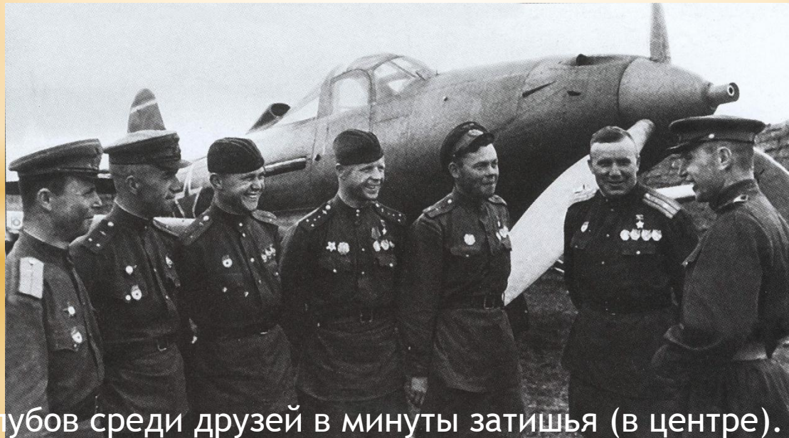
Александр Клубов среди друзей в минуты затишья (в центре). Справа от него Г. Речкалов (дважды Герой Советского Союза), Б. Глинка, А. Покрышкин, 1944 год.

Второй медалью «Золотая звезда» он был награжден уже посмертно. Звания дважды Героя Советского Союза за подвиги в Великой Отечественной Войне было удостоено всего 104 человека.